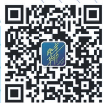
官方微信公众账号