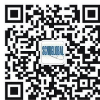
华师国际交流 微信公众账号