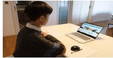
监控设备呈现示意图