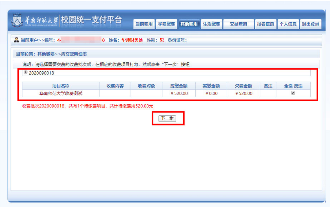
图 2 欠费信息

1. 点击导航栏的“其他费用”按钮，显示欠费项目和选择页面，选择欠费项目，点击“下一步”，如图 2 所示；