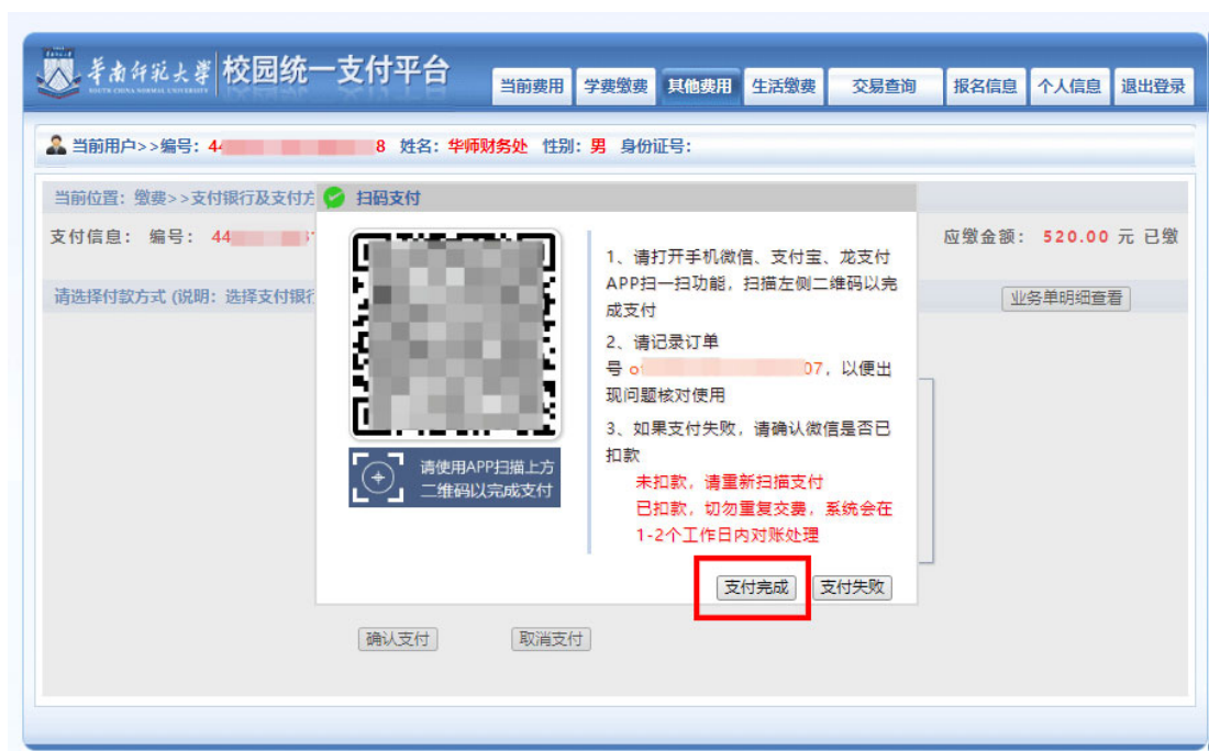
图 5 网上支付