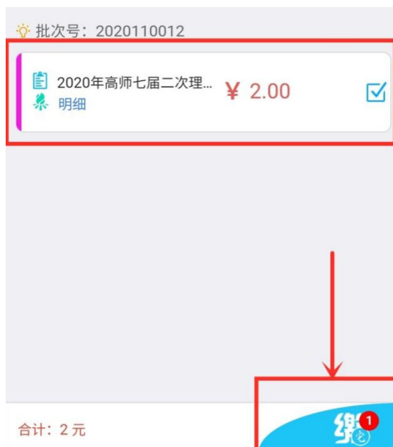
图 4 缴费项目