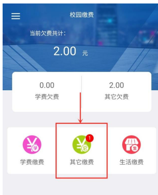
图 3 其他缴费