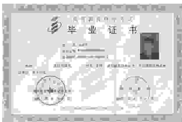
自学考试专科毕业证样板

● 教育管理专业： 中国近现代史纲要、马克思主义基本原理概论、教育管理原理、教育评估和督导、教育经济学、教育统计与测量、教育管理心理学、教育法学、中外教育管理史、教育科学研究方法（二）、教育预测与规划；毕业论文；选考课程：英语（二）、班级管理学、现代学校人力资源管理、教育财政学、高等教育管理、中小学教育管理、学前教育管理。