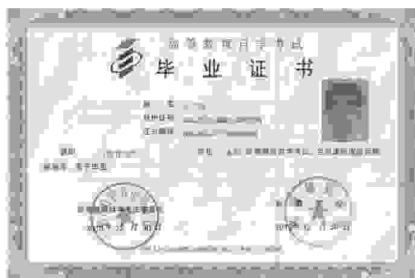
自学考试本科毕业证样板