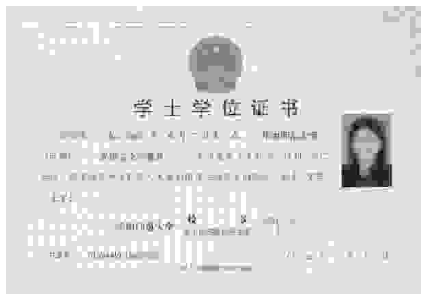
自学考试学士学位证样板