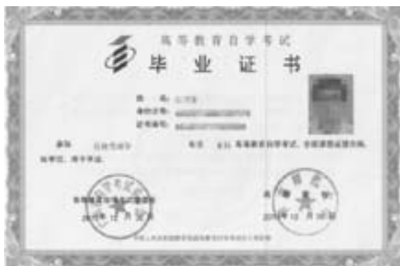
自学考试本科毕业证样板