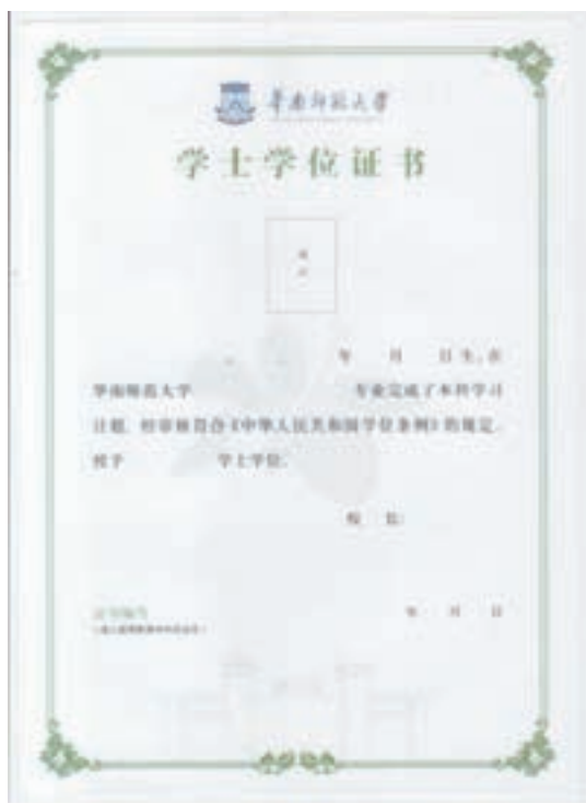
自学考试学士学位证样板