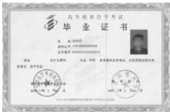
自学考试专科毕业证样板