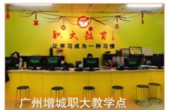
广州增城职大教学点