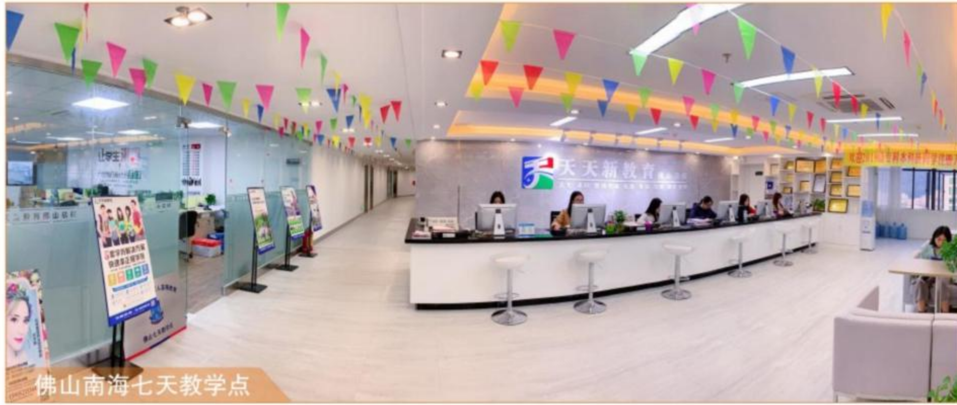
佛山南海七天教学点