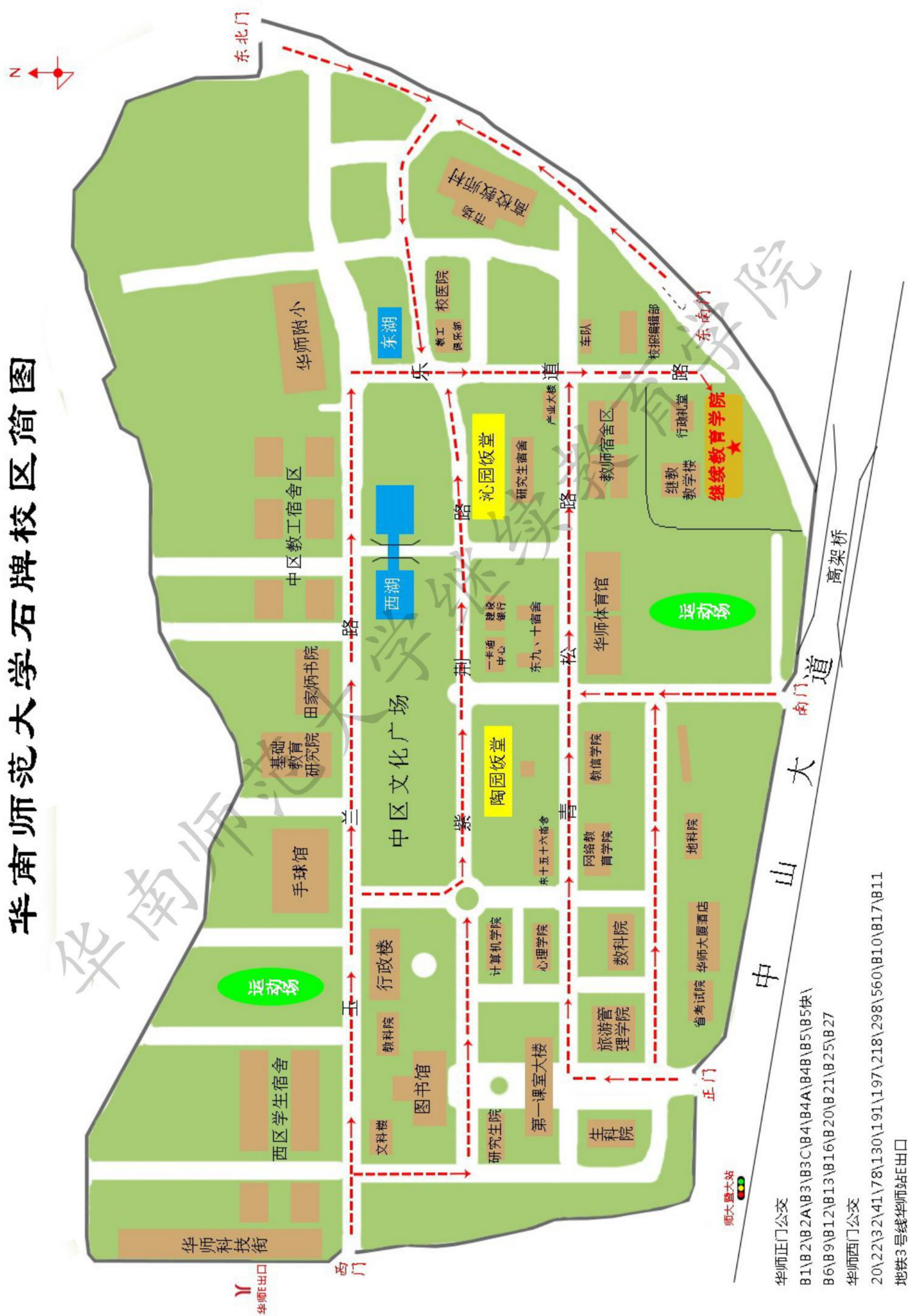
华南师范大学石牌校区简图

师大型出站 华师正门公交 B1\B2\B2A\B3\B3C\B4\B4A\B4B\B5\B5快\B6\B9\B12\B13\B16\B20\B21\B25\B27 华师西门公交 20\22\32\41\78\130\191\197\218\298\560\B10\B17\B11 地铁3号线华师站E出口