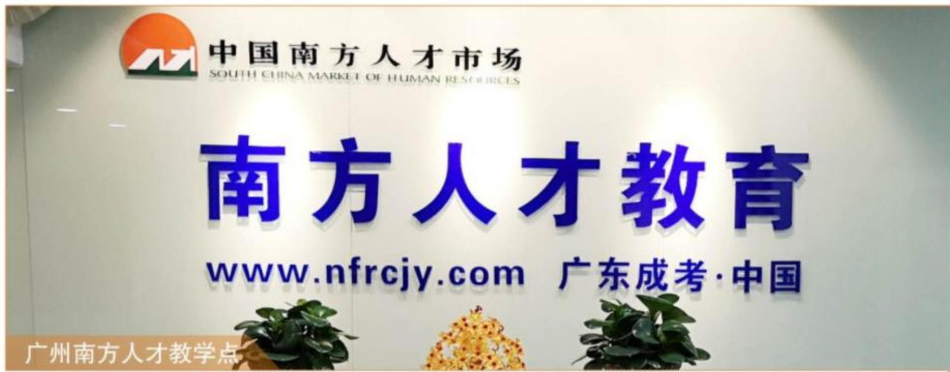
广州南方人才教学点