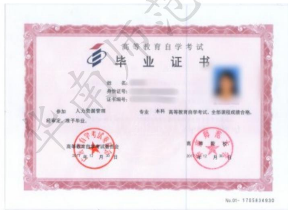
本科毕业证书样式