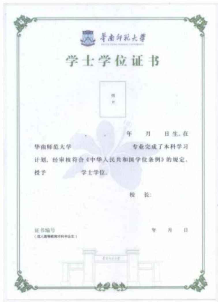
学士学位证书样式