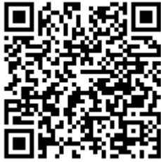
IOS 版企业微信 APP