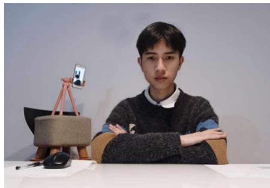
主机位呈现的画面示意图

摄像头已打开，点击后关闭摄像头， 面试时禁止使用虚拟背景，且将人体胸部及以上部位显示于画面中，两手置于胸前