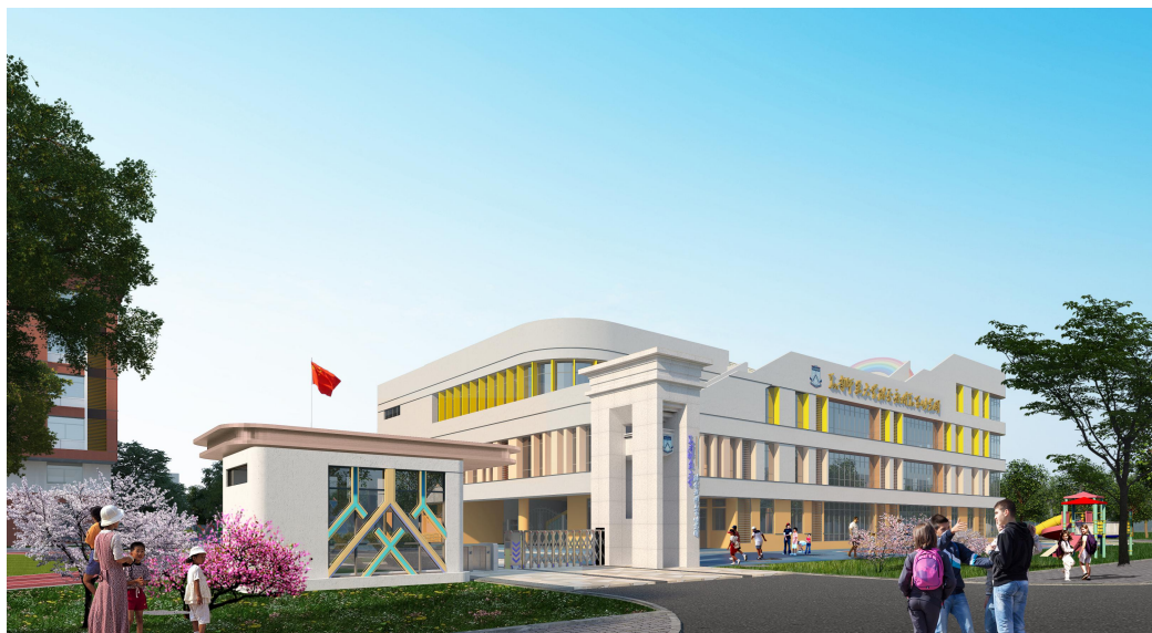
△华南师范大学附属广州华万幼儿园