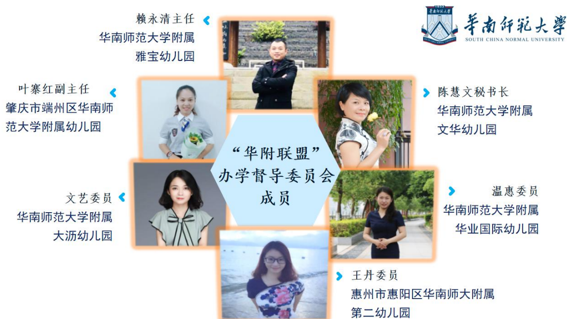
△ 华南师范大学对外合作办学（学前教育）办学督导委员会成员

为了保证办园质量，华南师范大学教育发展中心遴选拥有丰富幼儿园管理经验的“华附联盟”优秀园长组成华南师范大学对外合作办学（学前教育）督导委员会。督导委员定期对合作园所进行交叉督导，有效规范办园行为，掌握办园动态，评估办园质量，支持各合作园所打造为当地学前教育高地。