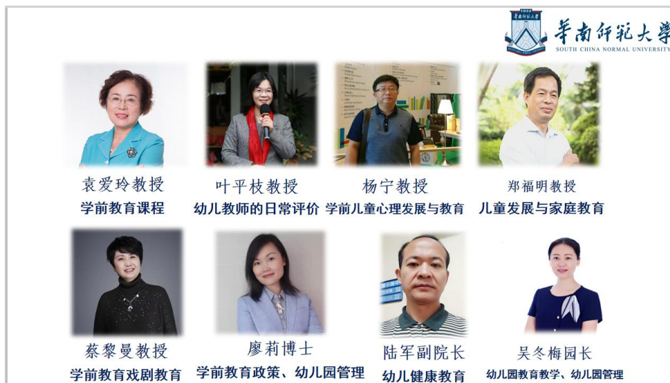
△ “华附联盟”（学前教育）专家委员会成员