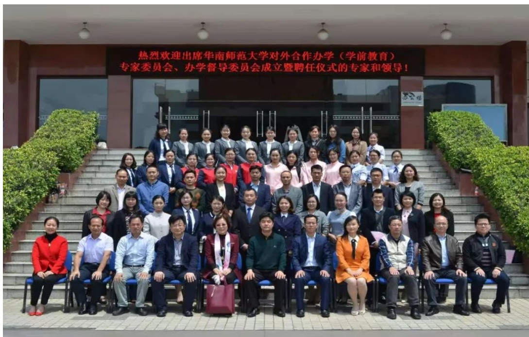
△华南师范大学对外合作办学（学前教育）专家委员会、办学督导委员会

为建立校内外资源整合和人才储备机制，搭建高水平的办园平台，华南师范大学教育发展中心成立华南师范大学对外合作办学学前教育专家委员会，对华南师范大学对外合作办园工作进行专业性的决策咨询和指导。专家委员研究领域涵盖儿童保健保育、教师专业成长、家庭亲子教育、儿童心理健康、园本课程建构等。专家团队定期开展教师培训，提供教学指导，组织家长课堂和支持办园规划，指引幼儿园专业发展，为孩子健康成长保驾护航。