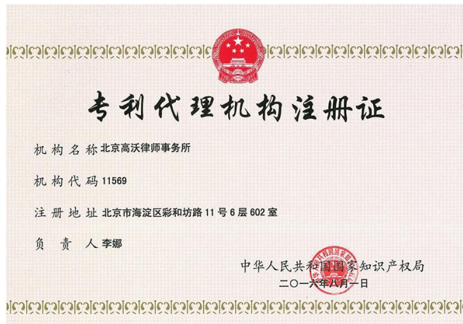
已备案的专利代理公司名单（61家）