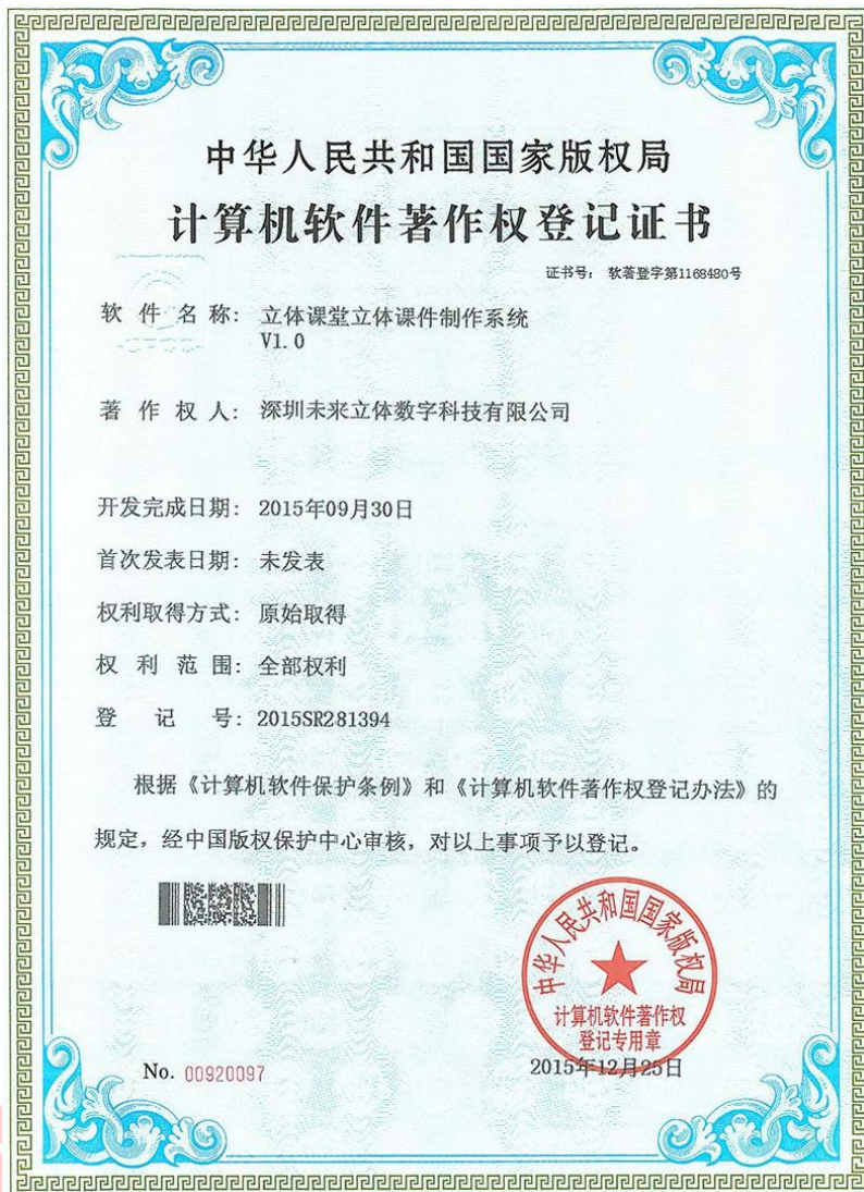
华南师范大学 计算机软件著作权登记备案表