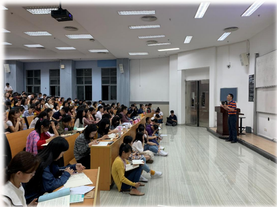
勤勤论坛之创新活动