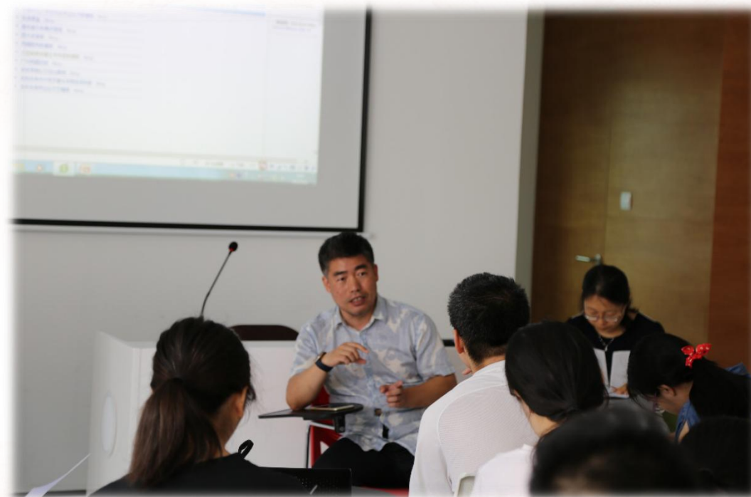
古籍文献检索讲座