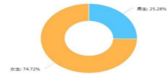
图1 样本的性别分布

样本中，有男性406名，占样本总数的比例为25.28%；女性1200名，占样本总数的比例为74.72%。性别分布与我校学生的性别比例分布基本一致。