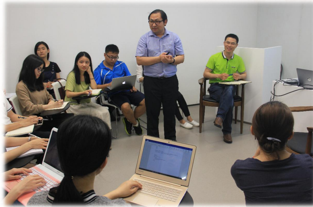
信息素养教育沙龙