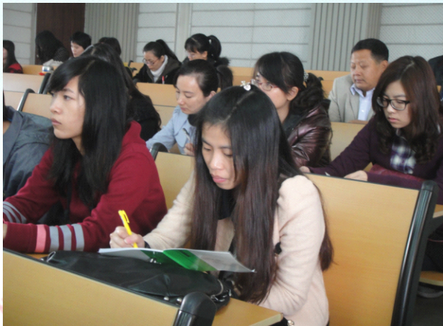
认真笔记 心无旁骛