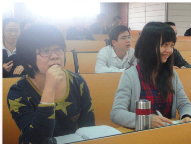
共鸣之处 会心一笑