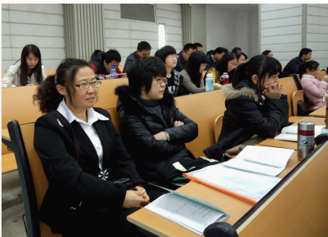
专心听课 求知若渴