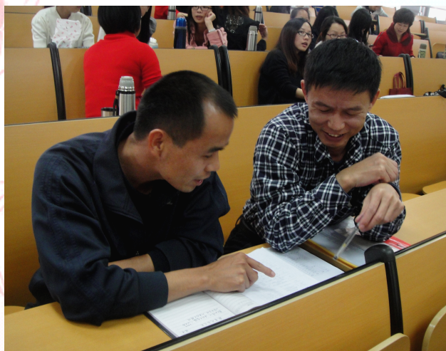
你言我语 分享智慧