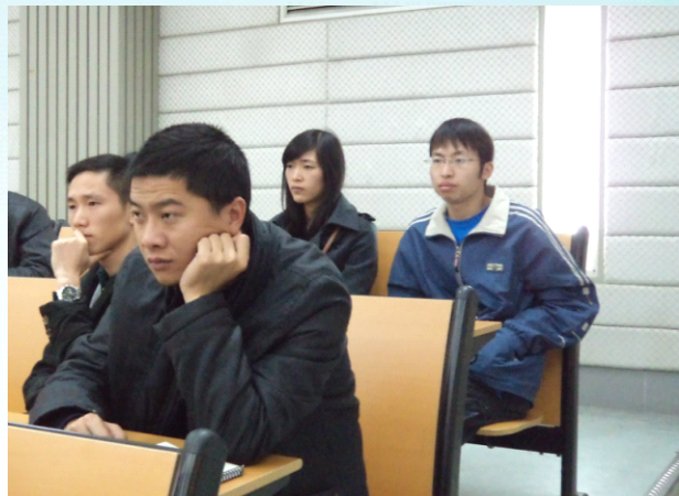
抬首冥思 渴求知识