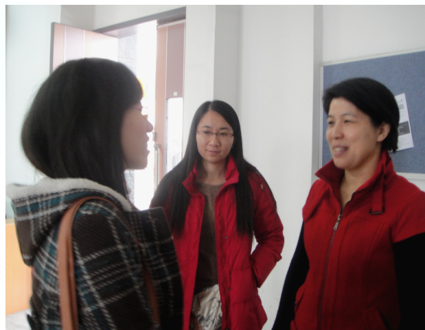
课间交流 名师解惑