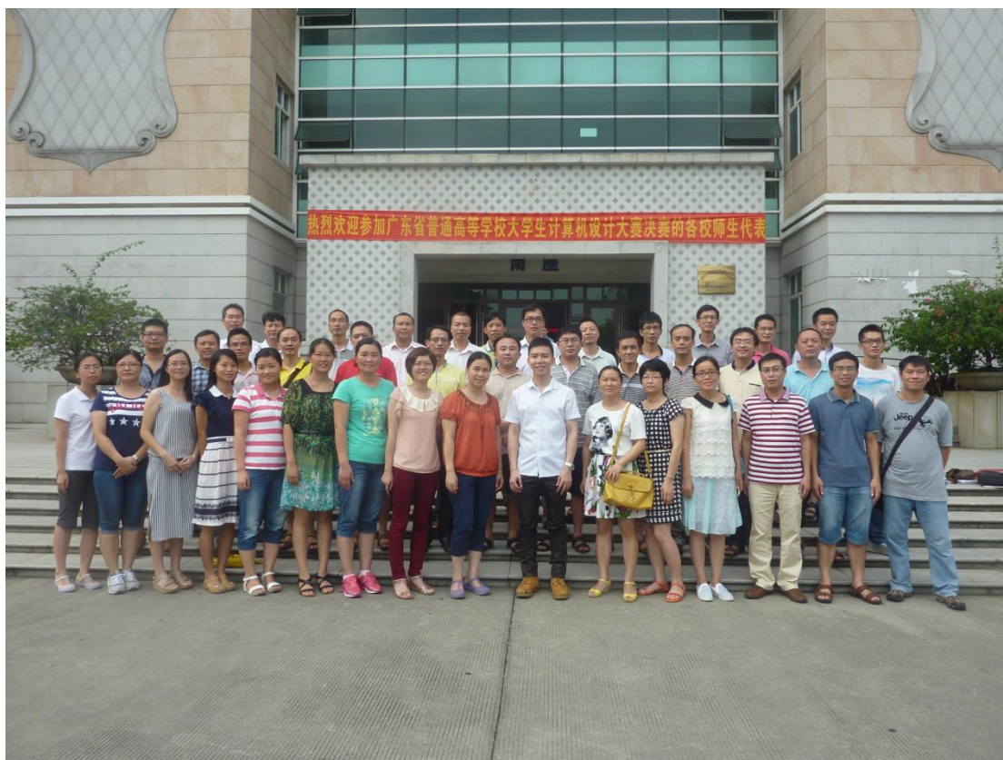
省级培训项目高中数学研修 1 班全体学员合影