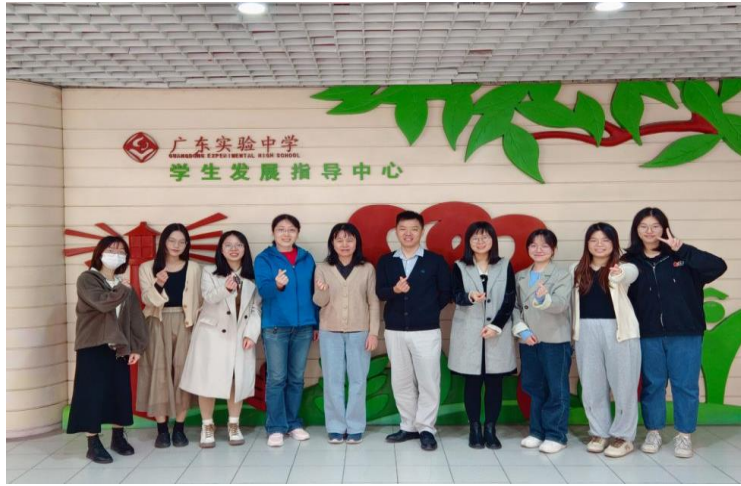
图 4：广东省实验中学的心健实习生与指导老师们