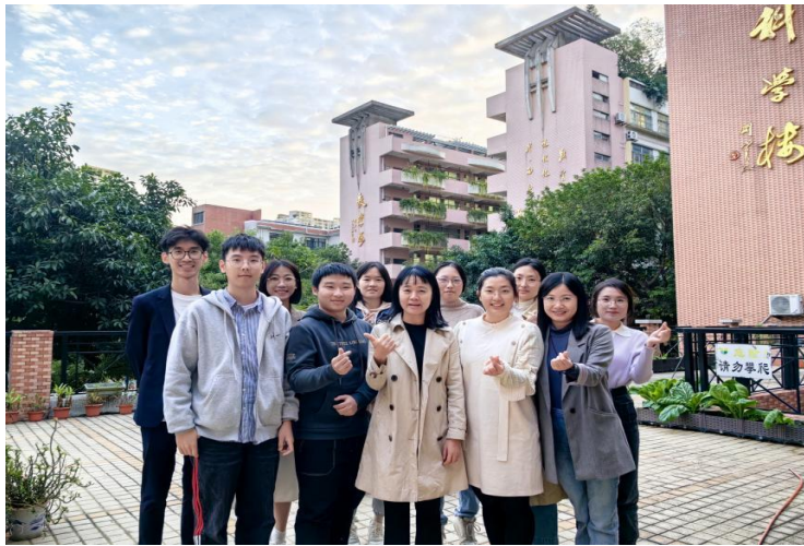
图 5：广州市育才中学的心健实习生与指导老师们（图中有其他实习生）