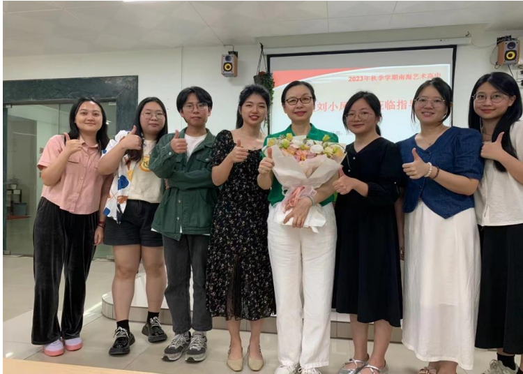
图 10：佛山市南海区艺术高中的心健实习生与指导老师们（左四为心健实习生）