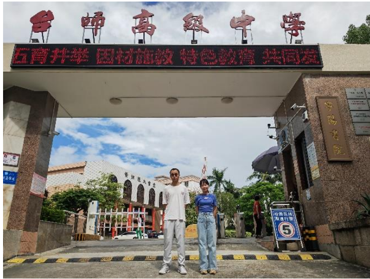
图7：台山市台师高级中学的两位心健实习生