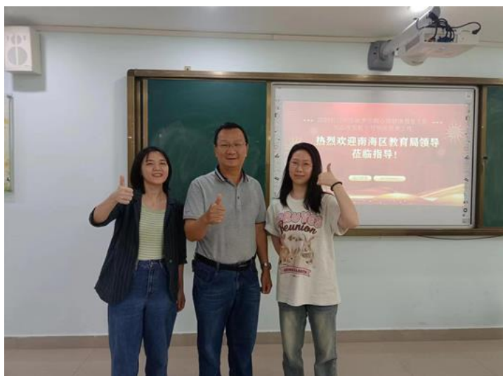
图9：佛山市南海区石门中学的心健实习生与指导老师（左一为心健实习生）