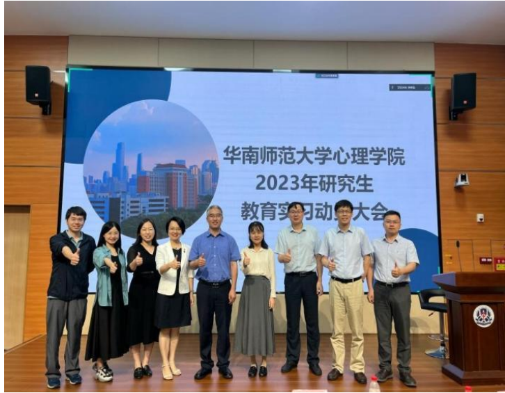
图 1： 实习动员会上学院领导与指导老师们