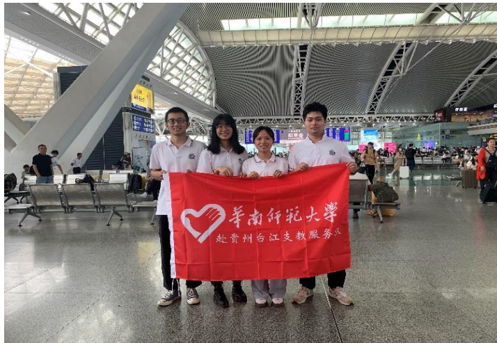
图8：心理学院赴贵州台江支教服务队（左二和左三分别为研二和研一的心健实习生）