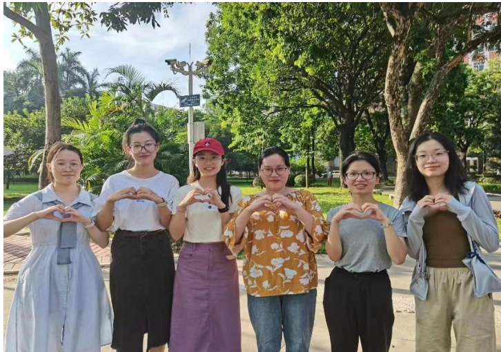
图 3： 赴汕尾的心健实习生与指导老师