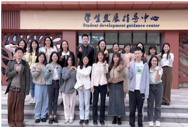
图 6：广州市执信中学的心健实习生与指导老师们（图中有其他实习生）