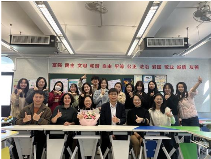
图 2： 华南师范大学附属中学的心健实习生与指导老师们（图中有其他实习生）