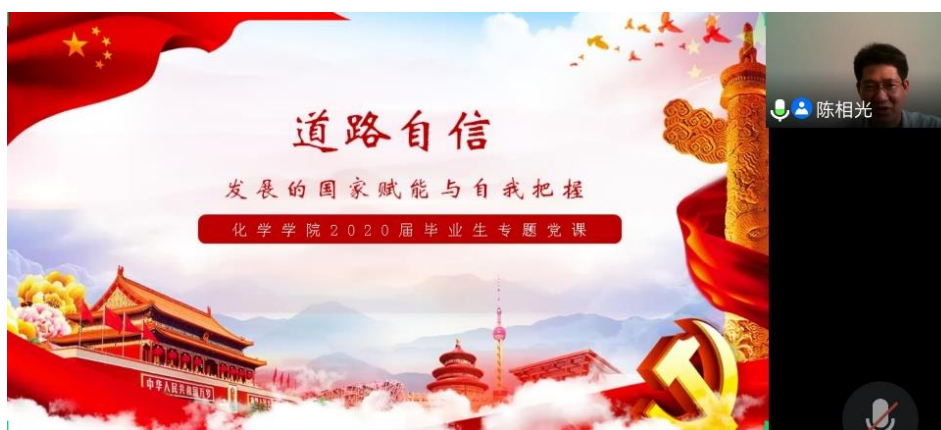
图 1 陈相光书记授课截图

2020 年 7 月 1 日，时值中国共产党建党九十九周年，化学学院党委组织线上“书记茶座”暨 2020 届毕业生党员专题党课。学院党委书记陈相光以道路自信为切入点，分别就“道路自信的国家意义与具身价值”、“具身发展的国家赋能”、“具身发展的自我把握”展开授课。