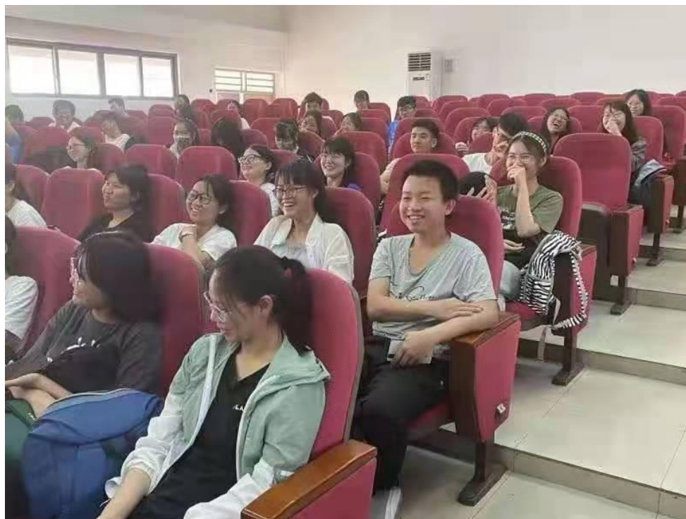
(同学们感受到王警官的幽默)

在进一步的演讲中，王警官谈到学生受骗的概率非常大，并强调了华南师范大学是诈骗重灾区，在本次讲座开始的前一天我院仍有同学被诈骗五万元，让在场的同学们都不要掉以轻心，谨防被骗，千万不要陷入典型的“受害人 5+1”心理。在他说到当今电信诈骗多数是在境外进行，且由于诈骗分子的技术手段越来越高明，警方难以去抓捕这些诈骗分子时，同学们的心情立刻紧张了起来，对“科学技术是把双刃剑”这句话有了更贴切的认识，然而当从他的口中也得知虽然目前难以追回全部被骗金额，但番禺区的紧急止付率达到 100%时，同学们也不禁在心中对番禺区的反诈骗能力悄悄点赞。