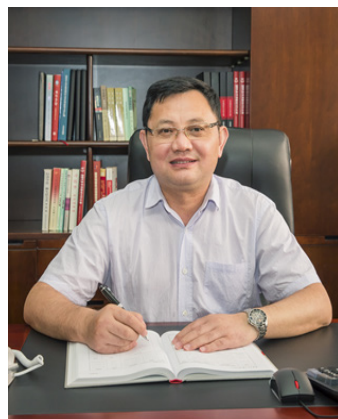
王恩科, 华南师范大学校长

华南师范大学始建于1933年，前身是广东省立勳勤大学师范学院。1996年进入国家“211工程”重点建设大学行列，2015年成为广东省人民政府和教育部共建高校，同年进入广东省高水平大学整体建设高校行列，2017年学校进入国家“世界一流学科”建设行列。学校现有广州石牌、广州大学城和佛山南海3个校区，占地面积3025亩，校舍面积155万平方米，图书374万册。