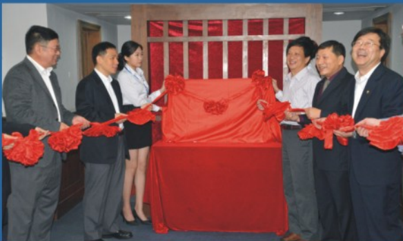
学校领导和学界业界领袖参加旅游管理学院成立揭牌