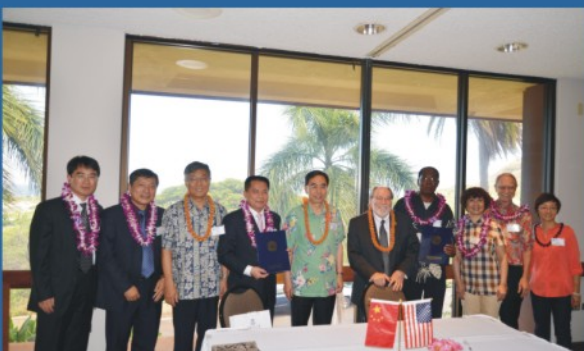
广东省长与夏威夷州长共同在檀香山见证华南师范大学与夏威夷大学签订全面合作协议