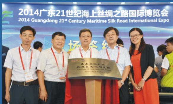
学院省级创新平台海上丝绸之路旅游与文化研究院揭牌