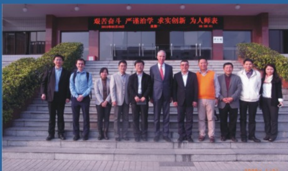
瑞士洛桑酒店管理学院前任校长到访商谈合作