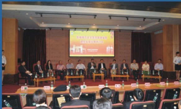
学院发展战略研讨会