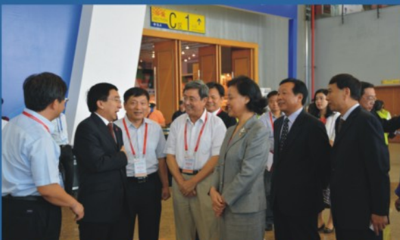
学院领导在首届“海博会”与国家旅游局、广东省领导亲切交谈