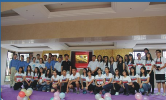
学院与我省唯一的世界文化遗产地开平碉楼共建实习实践和研究基地