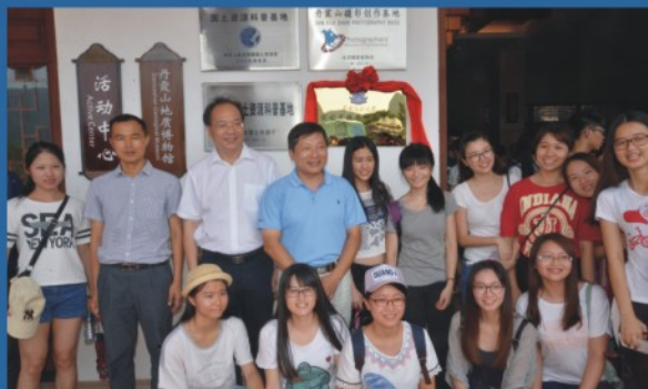
学院与我省唯一世界自然遗产地丹霞山共建实习实践和研究基地