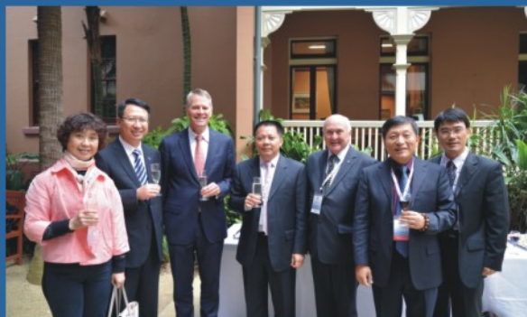
学院院长（右二）与澳洲新南威尔士州州长（左三）在悉尼商谈交流