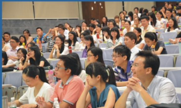
同学们实习分享会上欢声笑语