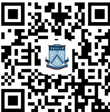
校园统一支付平台 二维码