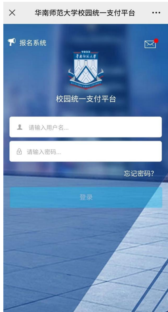
图 2 校园统一支付平台 登陆界面