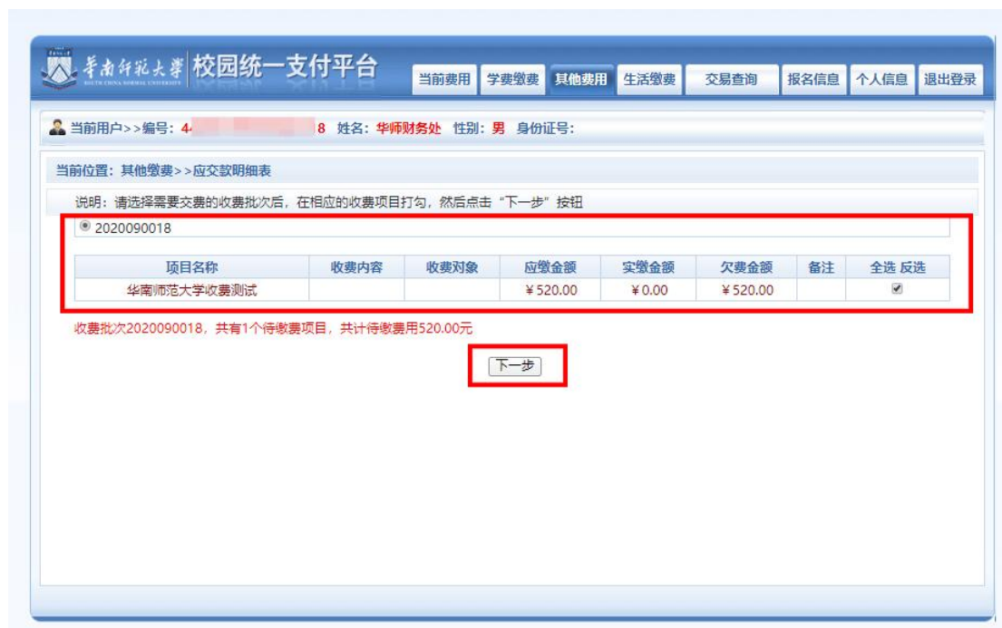
图 2 欠费信息

1. 点击导航栏的“其他费用”按钮，显示欠费项目和选择页面，选择欠费项目，点击“下一步”，如图 2 所示：