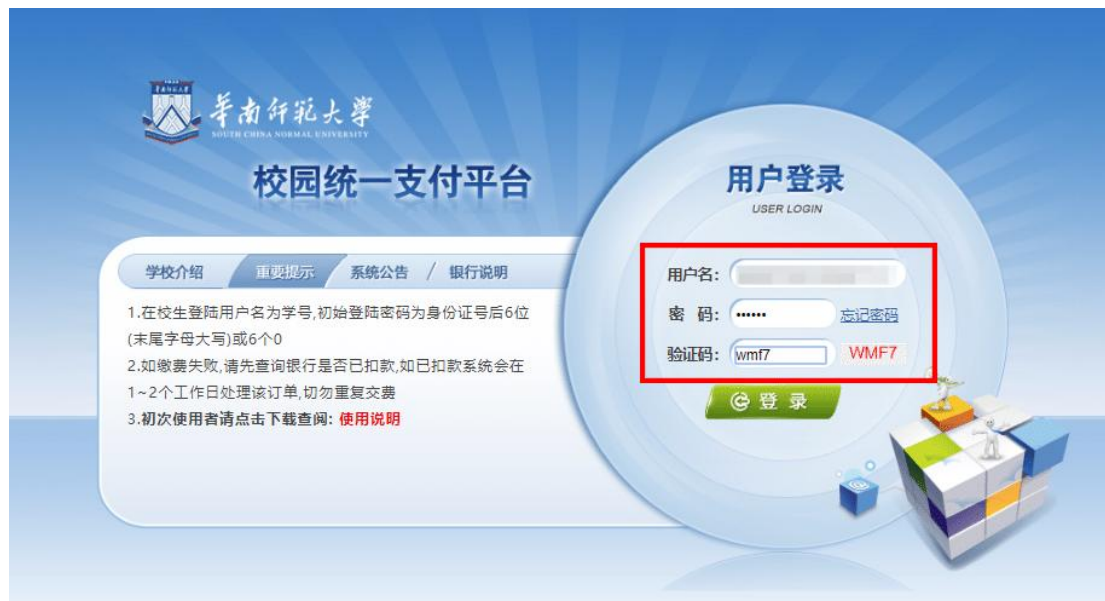
图 1 校园统一支付平台登陆界面

在浏览器地址栏输入： http://hscwxf.scnu.edu.cn ，打开“华南师范大学校园统一支付平台”，如图 1 所示。