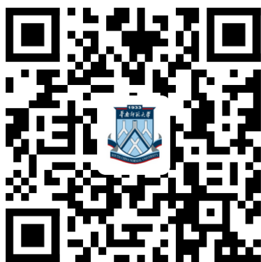
图 2 校园统一支付平台 二维码