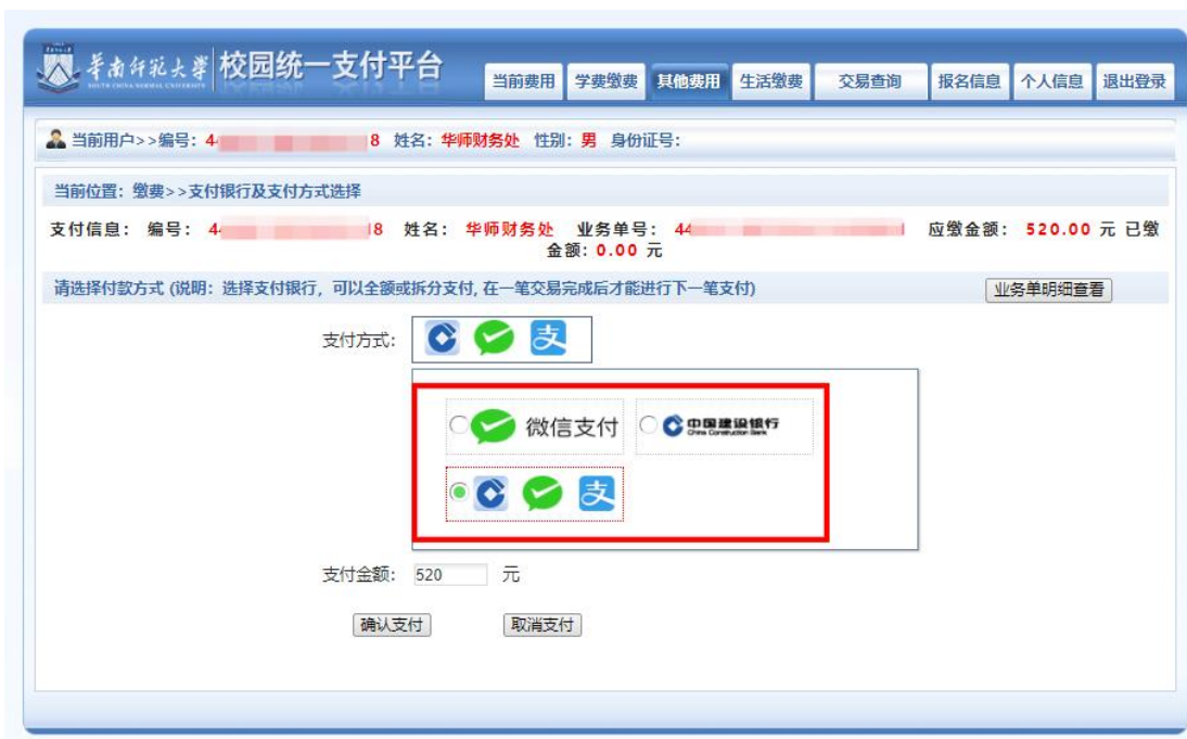
图 4 缴费方式选择

4. 核对支付金额。确定支付金额无误后, 选择支付方式, 点击“确认支付”, 将会弹出付款二维码, 请使用微信、龙支付、支付宝进行扫码支付, 如图 5 所示。