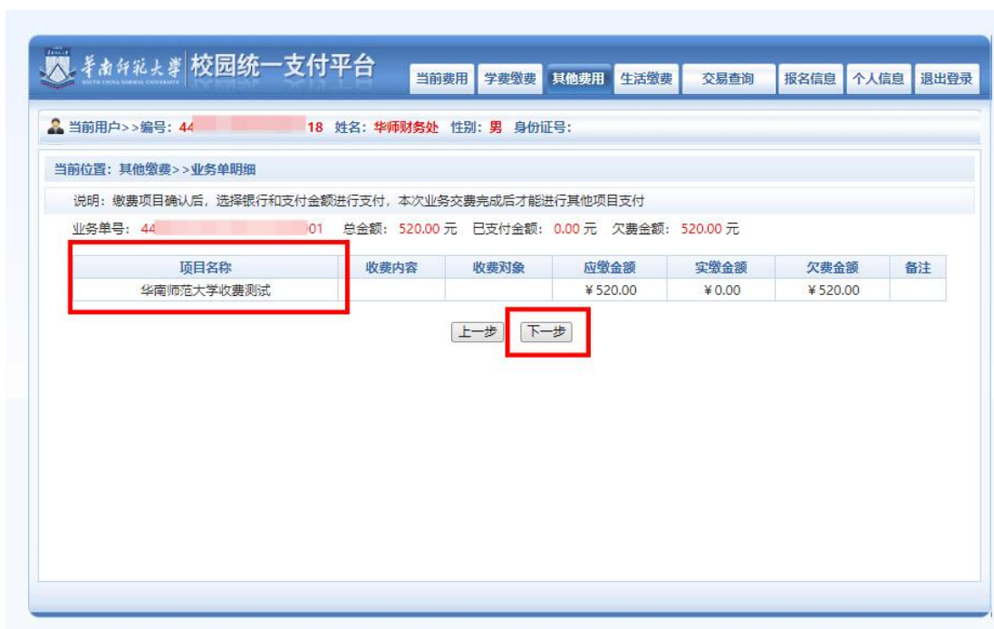
图 3 缴费信息