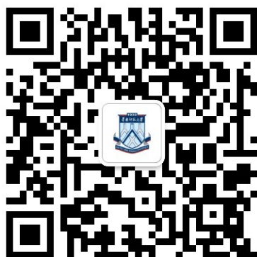
图 1 微信公众号二维码

点击“业务办理”——“统一支付平台”，如图 1。打开“华南师范大学校园统一支付平台”，如图 2 所示。