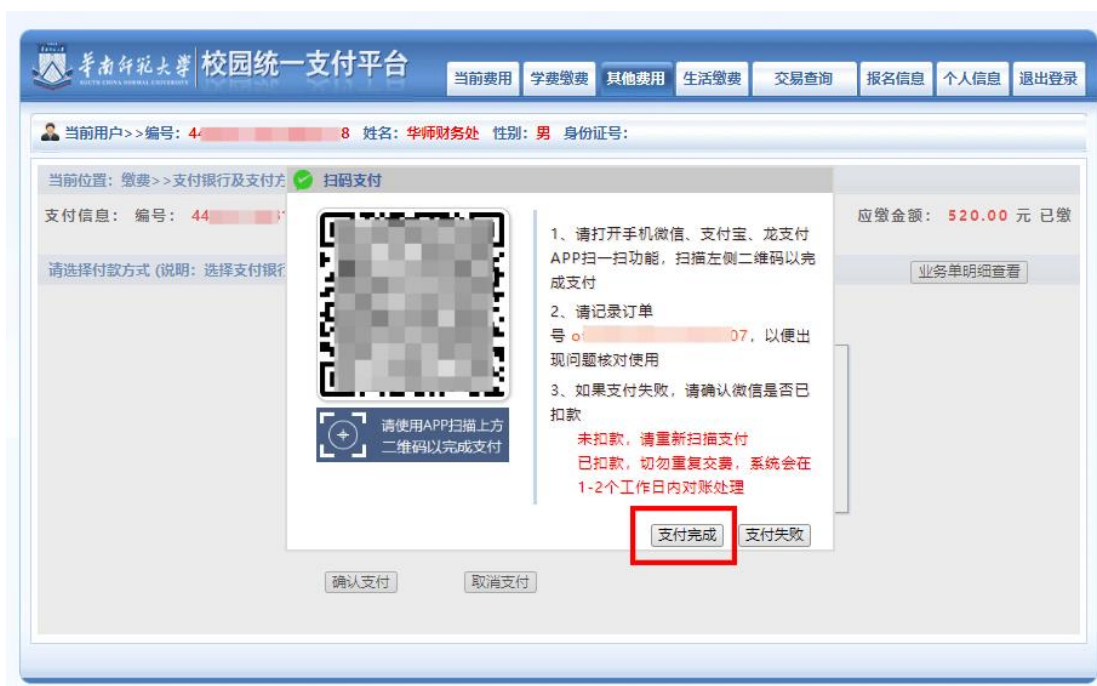
图 5 网上支付