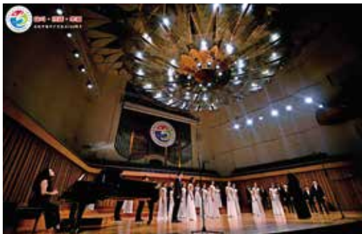
华南师范大学合唱团赴成都参加全国第六届大学生艺术展演活动现场