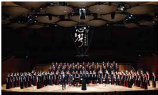
华南师范大学音乐学院合唱团在星海音乐厅举办《心声》第六季系列专场音乐会

建院三十余年来，学院始终把“讲台上的优秀教师、舞台上的合格演员和课外音乐活动中的出色组织者”作为人才培养的目标，同时，以学院优秀的教学师资为基础，以优良的学风为传承，以学院的团、学组织为培养载体，以四大专业艺术团（合唱团、交响乐团、舞蹈团、民乐团）为培养平台，为我院学子成长成才构筑坚实的保障。学院师生先后多次在“中国音乐金钟奖”、“世界合唱比赛”、“中国舞蹈荷花奖”、全国大学生艺术展演、“珠江·恺撒堡钢琴”全国普通高等学校音乐教育专业本科学子基本功展示、“长江杯”全国高校音乐教育专业自弹自唱邀请赛、广东省本科高校师范生教学技能大赛音乐组决赛、“百歌颂中华”歌咏活动等国内外专业竞赛（展示）中荣获重要奖项和赞誉。庆祝中国共产党成立 100 周年文艺演出《伟大征程》组织 56 名师生赴京参演；合唱团与广州交响乐团合作为“广东省庆祝中国共产党成立 100 周年”在广州大剧院演绎了一场合唱诗剧《那里，永恒的中国》；合唱团在广州星海音乐厅成功举办“心声”第六季系列专场音乐会等，深受社会及同行一致好评。