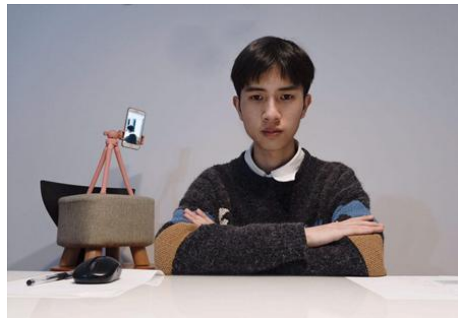
主机位呈现的画面示意图

摄像头已打开，点击后关闭摄像头，面试时禁止使用虚拟背景，且将人体胸部及以上部位显示于画面中，两手置于胸前