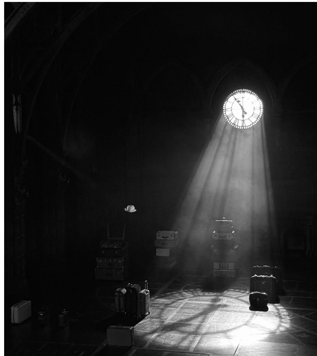
(Marg (加拿大) 的摄影作品)

这次的学生中，有一个极其吸引人的存在，一个白发苍苍的老奶奶。听说她的孙女都大学毕业啦！然后在晚餐的welcome party bar 我见到她跟她打招呼，她对我怀里的相机特别有兴致，我们回到了我的桌子坐下，开始聊天。她提出想看看我拍的照片，又问了一些问题，关于相机的，也有关于我是否是职业摄影师之类的，她告诉我她选的项目是电影，她想学拍照以及视频，以便记录家人的美好时光。她来自加拿大，提前了两周来英国，去了伦敦，还给我看了她在伦敦剧院里拍的照，那是几张黑白的照片，她说她喜欢那种黑白滤镜，太多色彩显得太拥挤，有几张照片真是惊到我了，很有艺术性，我告诉她拍的真好，不是奉承，是真心。我本想用相机拍下她手机里的照片，她说可以直接传给我，我鼓励她立马去买一个相机吧！她说这次的电影课会帮助她选择相机，在那之后，她会买一个，真是一个充满活力的 lovely old lady.