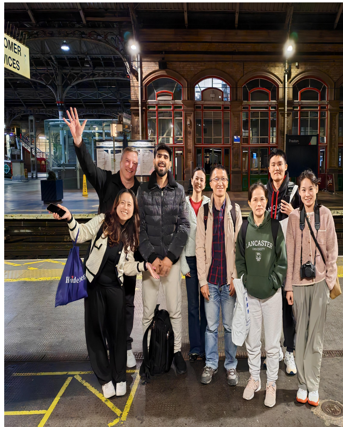
(华师学生和同行的外国友人合影)