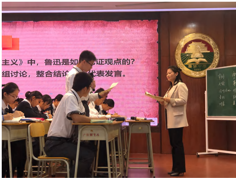
图2 小组代表分享讨论成果

在课堂上，同学们认真地思考与讨论本课的主问题“鲁迅先生在《拿来主义》中是如何论证自己的观点的”，重点讨论学习其中群喻的论证手法。其后以绘制思维导图的方式梳理全文的论证思路，深入思考鲁迅先生“先破后立”的创作缘由，在论证中渗透民族文化，展现文化担当。