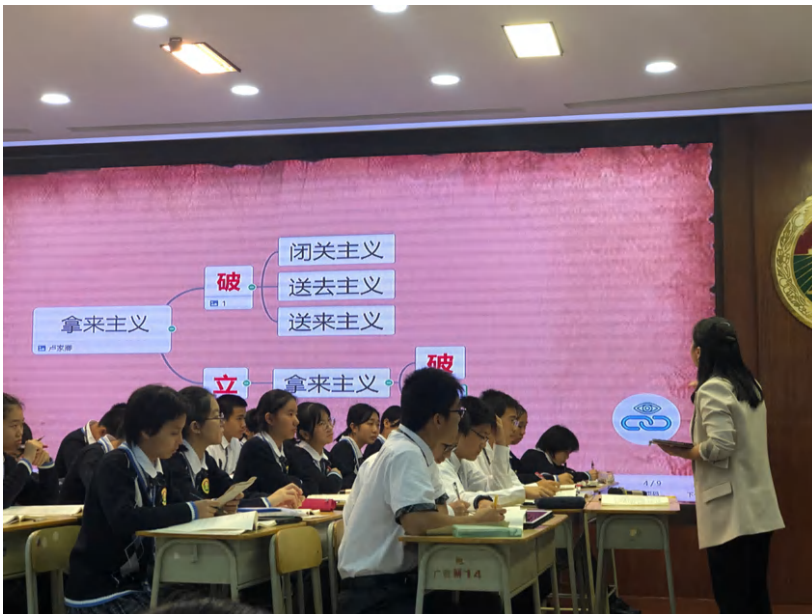
图3 师生讨论《拿来主义》的论证思路

在课堂上，同学们认真地思考与讨论本课的主问题“鲁迅先生在《拿来主义》中是如何论证自己的观点的”，重点讨论学习其中群喻的论证手法。其后以绘制思维导图的方式梳理全文的论证思路，深入思考鲁迅先生“先破后立”的创作缘由，在论证中渗透民族文化，展现文化担当。