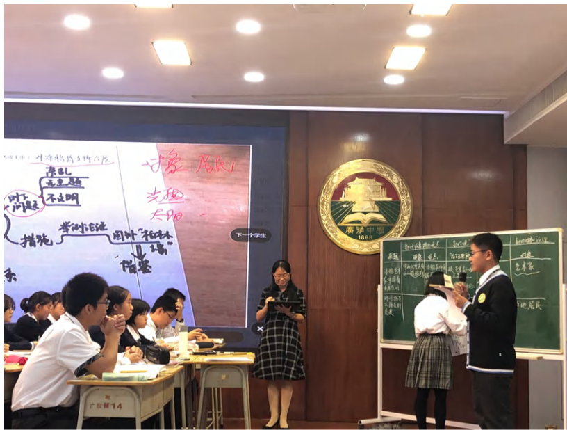
图4 学生小组代表发言

同学们将前两节课所获得的知识整合起来运用到实践中，系统地从论说对象、所针对的现象、提出观点、针对观点进行深入论述、说理几个方面阐释自己对城市涂鸦的观点态度。整堂课的师生讨论秩序井然，最后从现象、观点、对象三方面归纳指出议论文写作要有针对性。