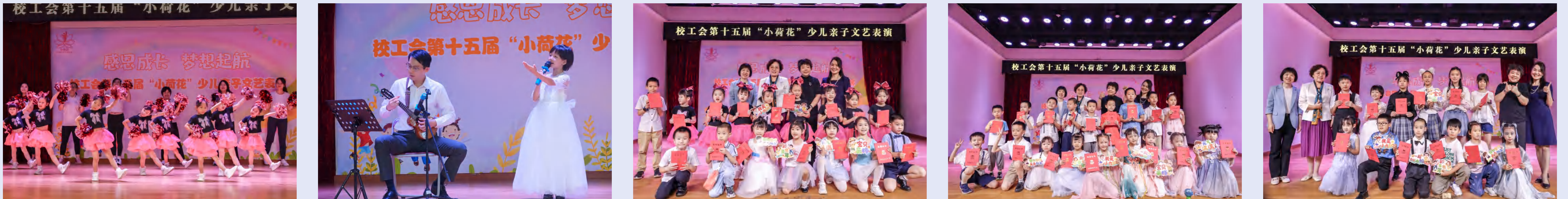
“感恩成长,梦想启航”第十五届“小荷花”少儿亲子文艺表演

举办第十五届“小荷花”少儿亲子文艺表演。表演以“感恩成长,梦想启航”为主题,涵盖了声乐、器乐、舞蹈、科普等33个节目;指导部门工会开展“六一”儿童节关爱活动,全校二十多个部门工会紧贴教职工家庭和子弟的需求,开展趣味运动会、手工制作等形式多样的活动,进一步促进亲子关系,助力美好家庭与和谐校园建设。