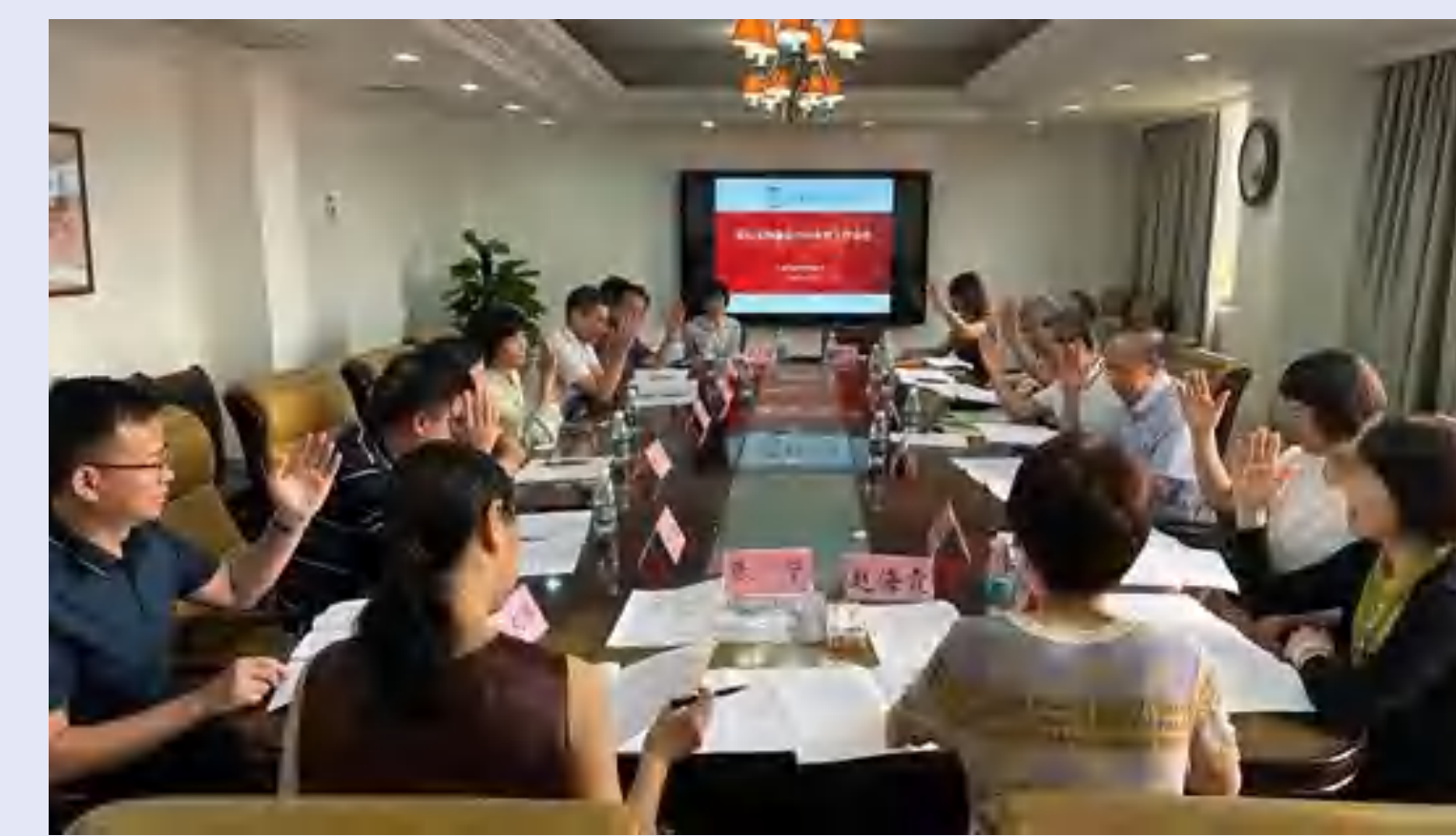
学校爱心互助基金会年度工作会议

继续完善工会多层次帮扶体系,逐步提高帮扶水平,倡导更多教职工加入省职工互助保障计划、省女职工安康互助保障计划以及学校爱心互助基金,实现“众人拾柴火焰高”的积极效果,召开学校爱心互助基金会2024年度工作会议。上半年,省职工医疗互助金申领3人,资助金额9万元;女职工安康互助金申领1人,资助金额4.5万元;爱心互助基金资助2人,合计3.2万元。