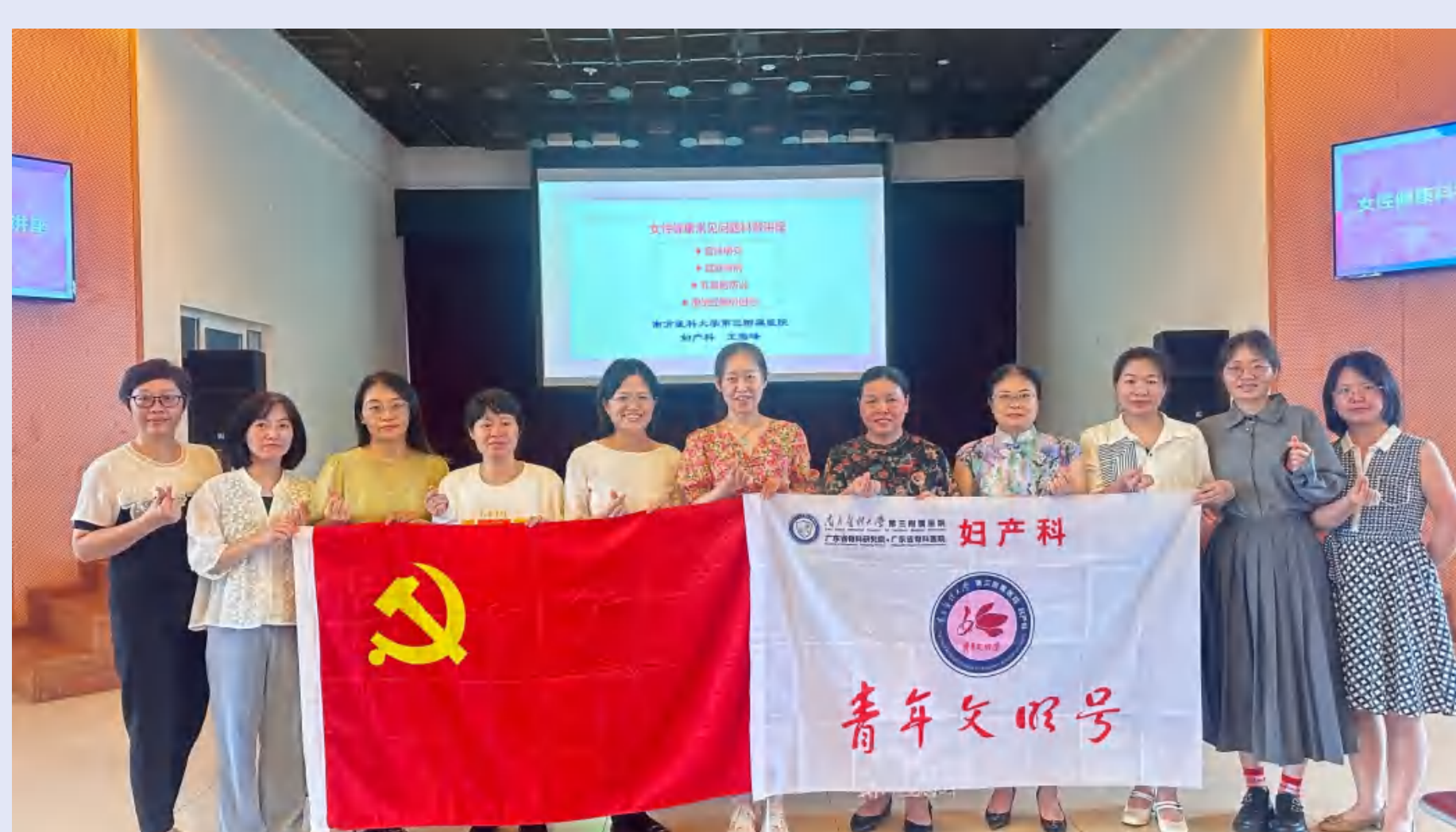
女性健康科学防护知识讲座