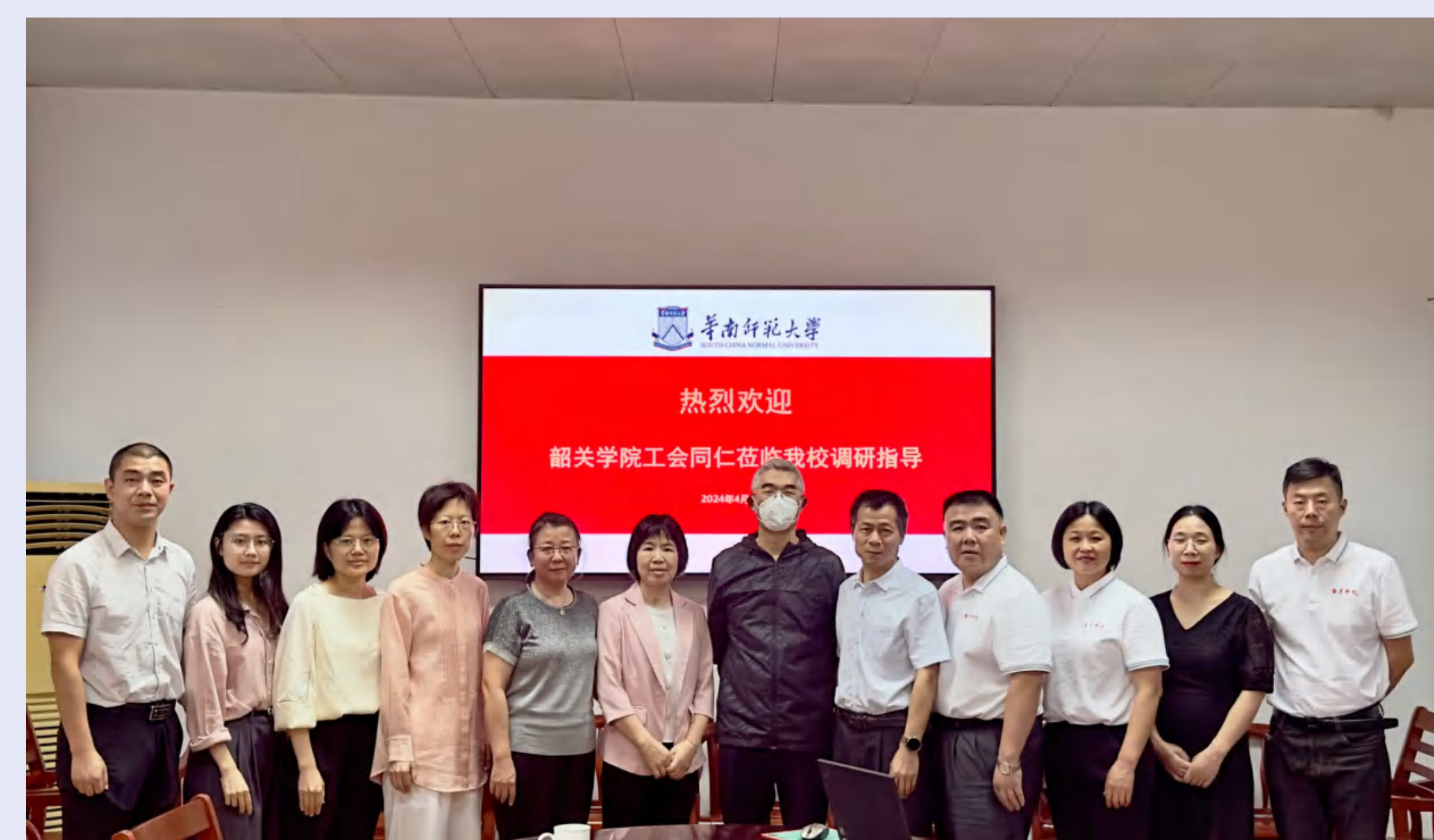
韶关学院工会到我校调研交流