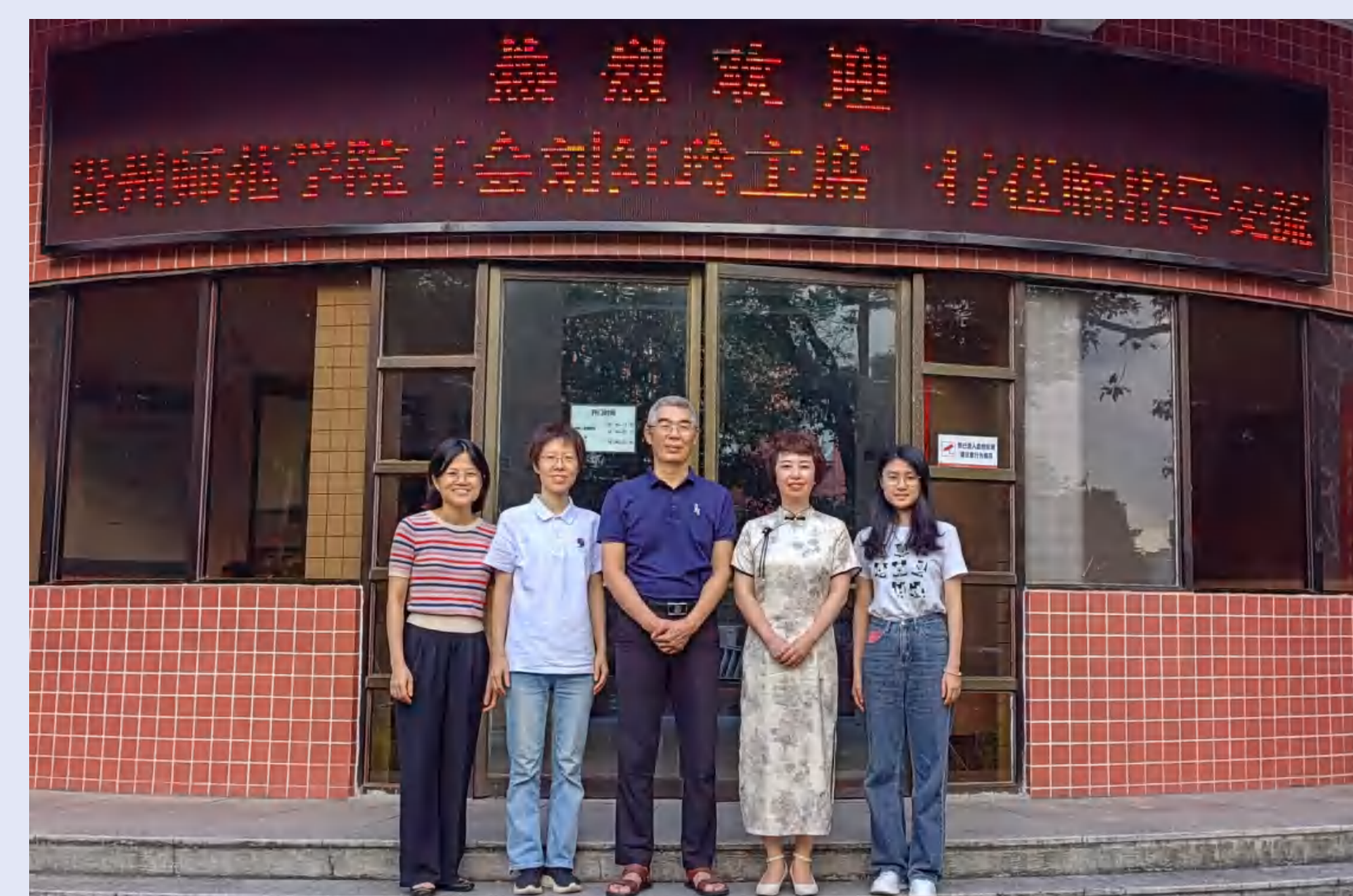
贵州师范学院工会到我校调研交流