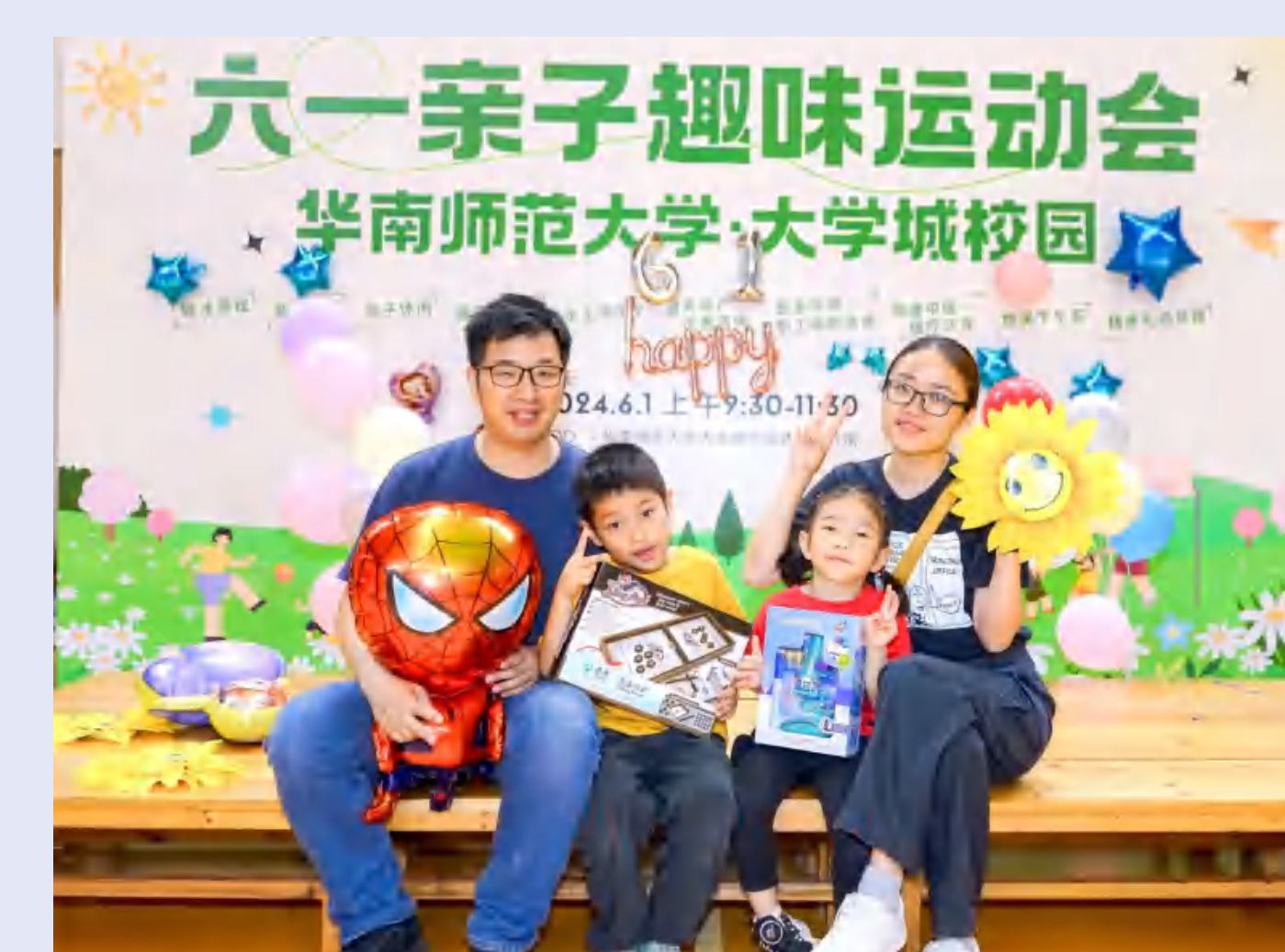
大学城校园“六一”亲子趣味运动会