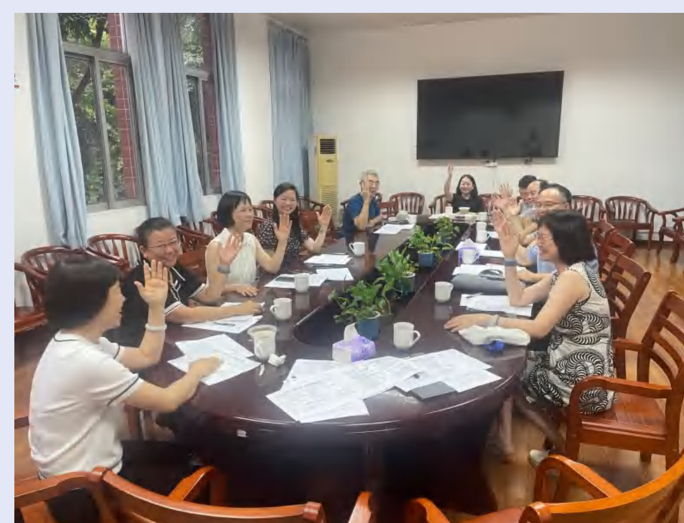
教代会常委会进行提案复审