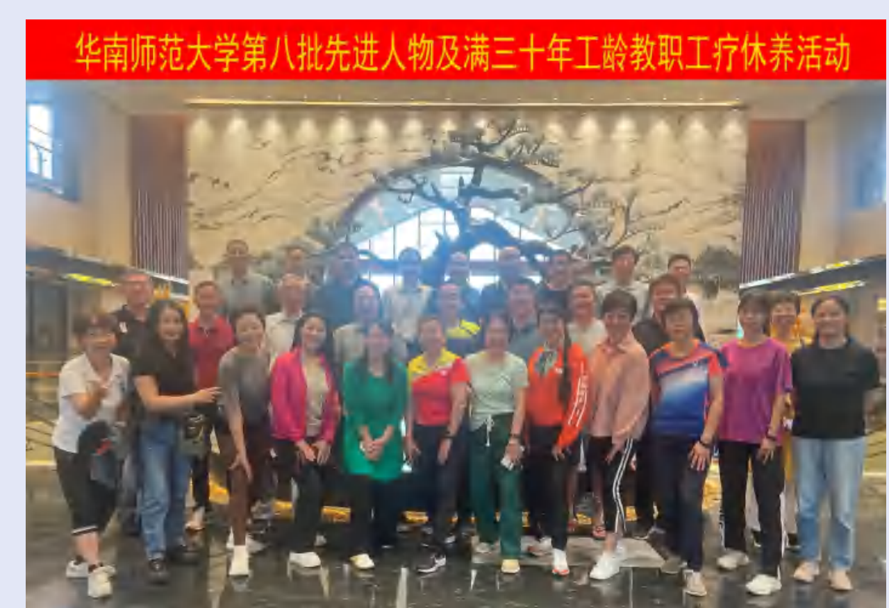
第八批先进人物及满30年工龄教职工疗休养活动