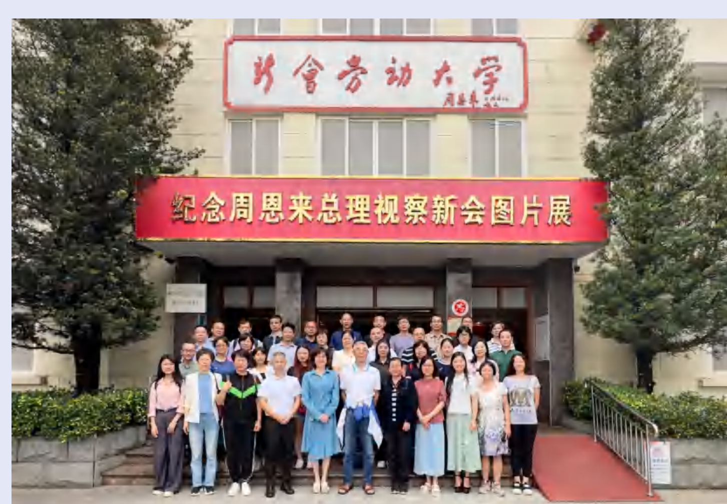
参观新会劳动大学集体合影