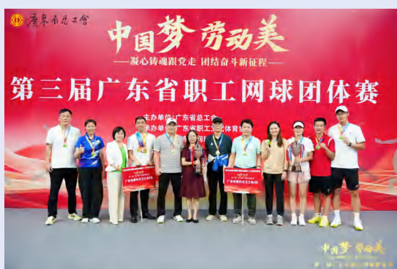
华师教职工网球队参加广东省职工网球团体赛

教职工网球队参加广东省职工网球团体赛获省直组第三名;教职工足球队参加广东省学校足球公开赛成绩优异。