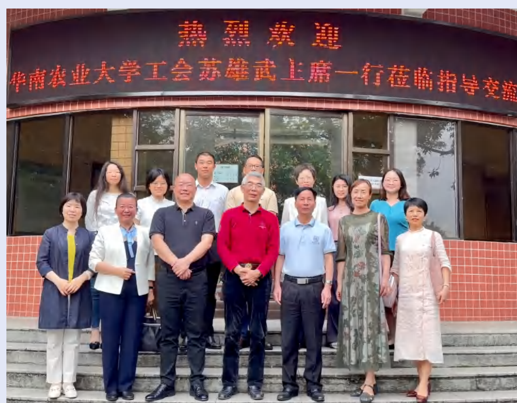
华南农业大学工会到我校调研交流