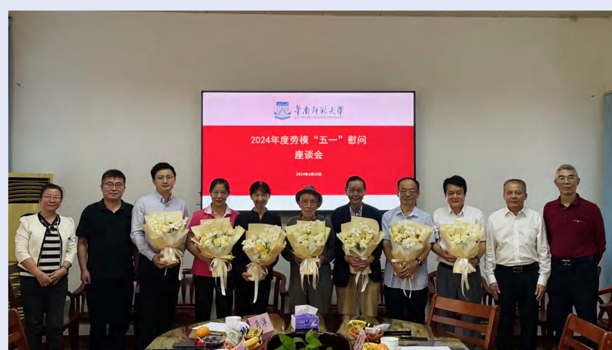
劳模慰问座谈合影