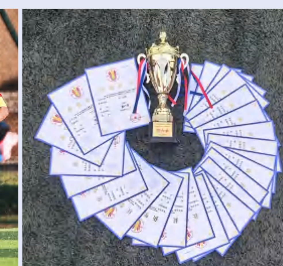
广东省学校足球 公开赛奖杯与荣誉证书