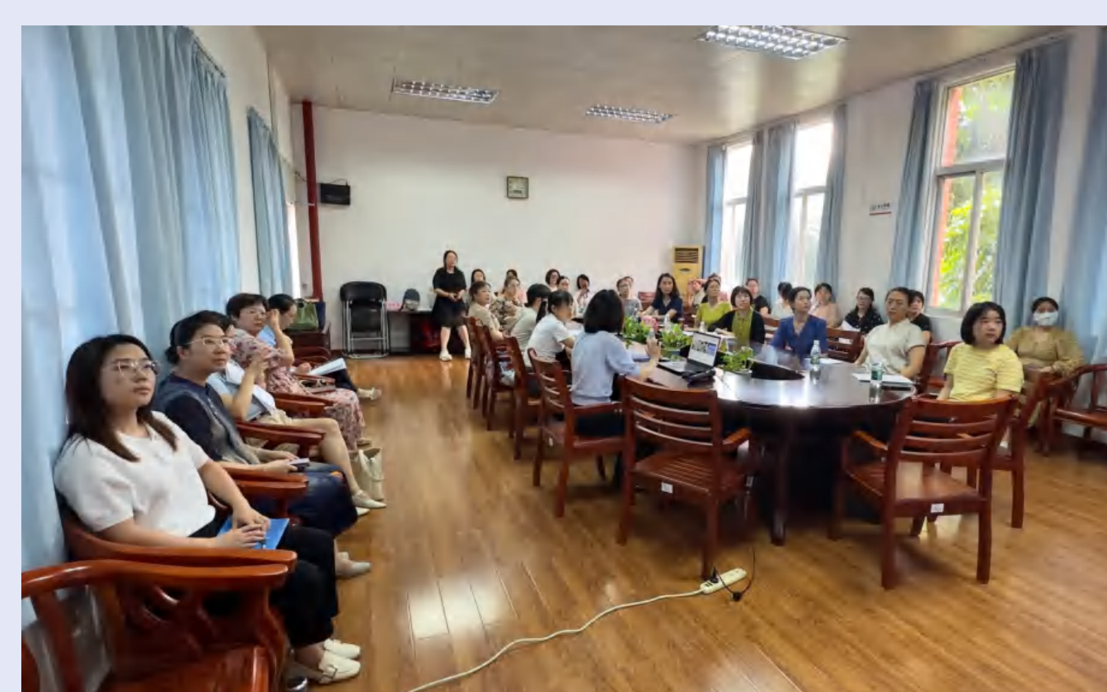
女工工作培训交流会暨“玫瑰书香”读书分享会