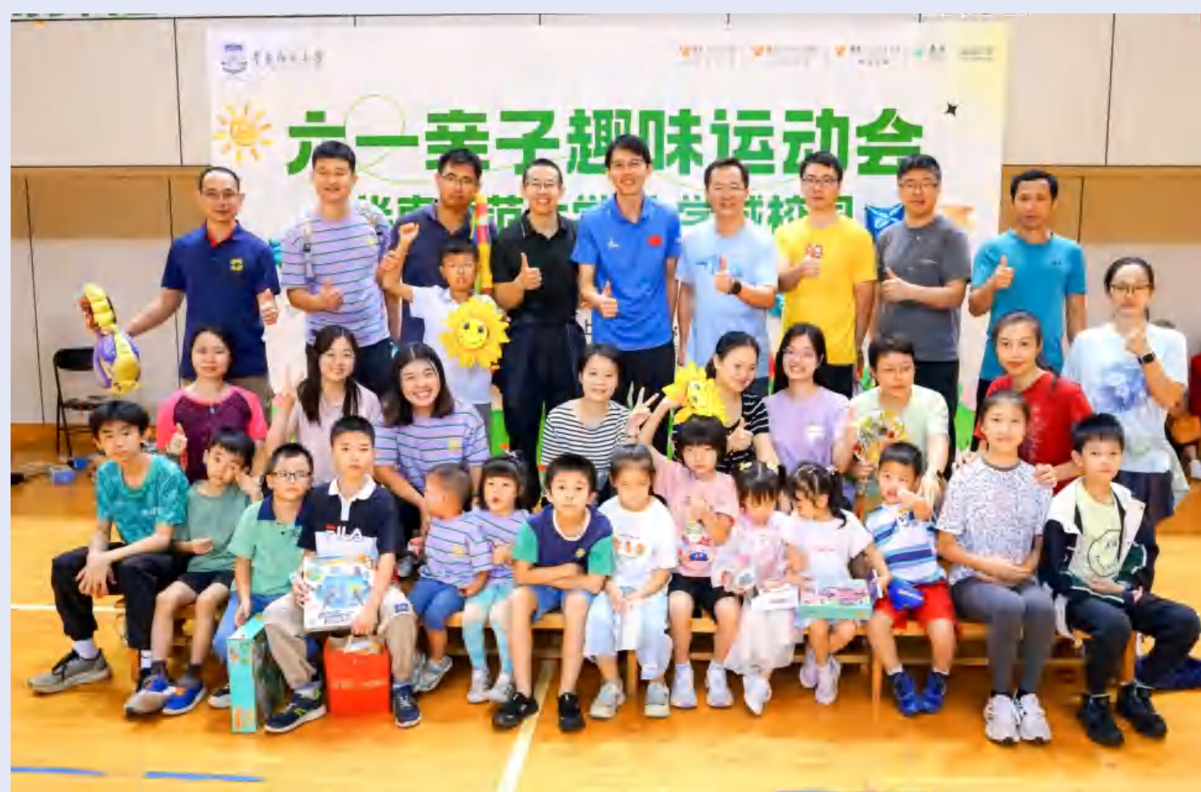
大学城校园“六一”亲子趣味运动会