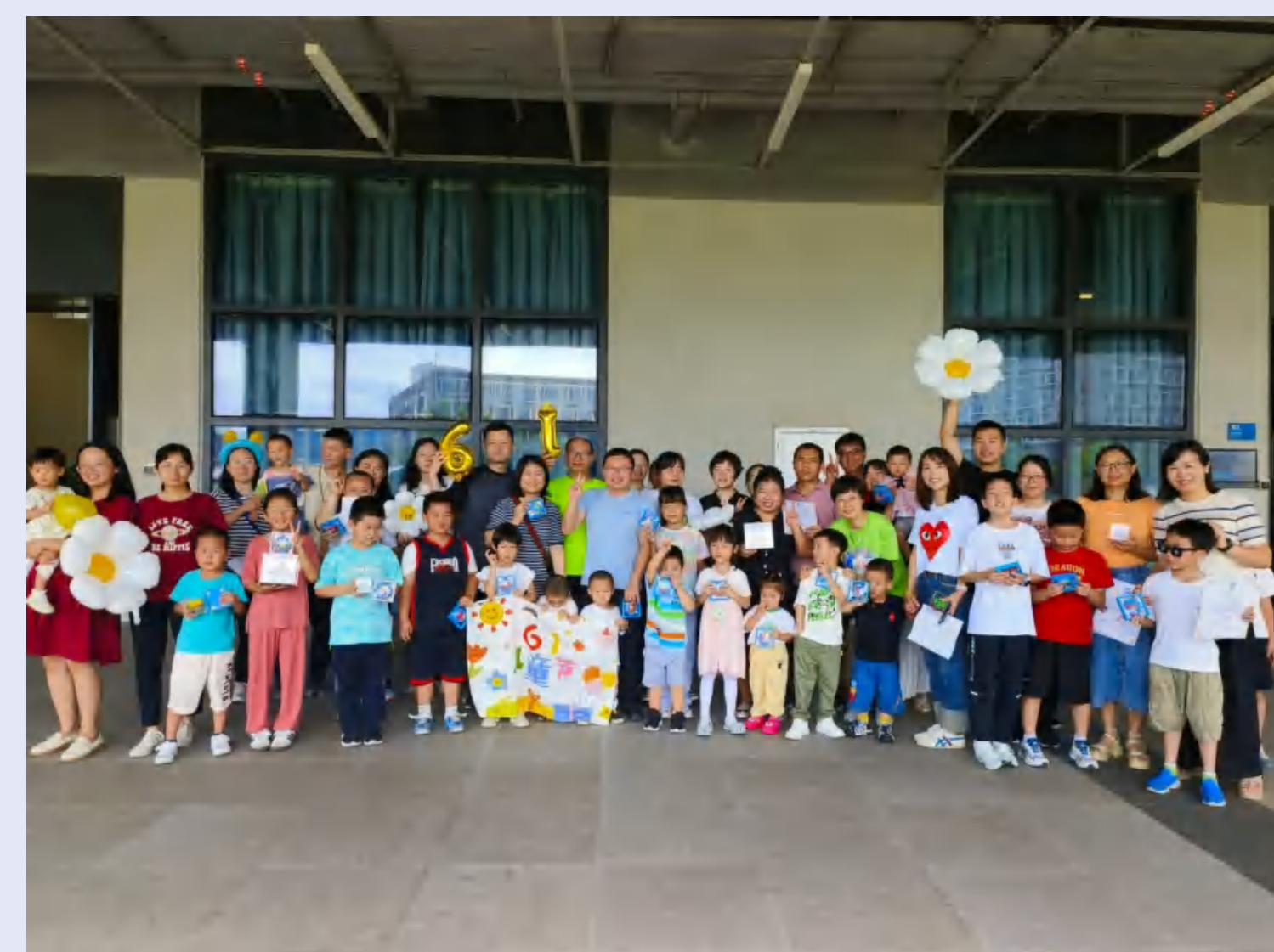
汕尾校区“六一”亲子软陶活动