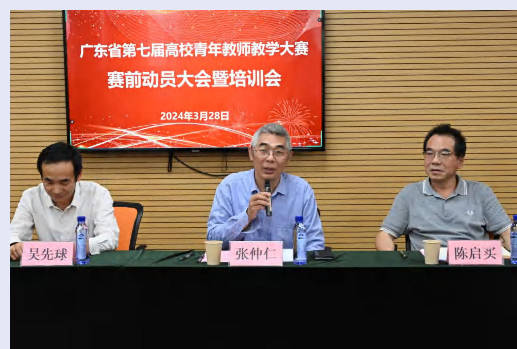
校工会常务副主席主持会议并作动员讲话