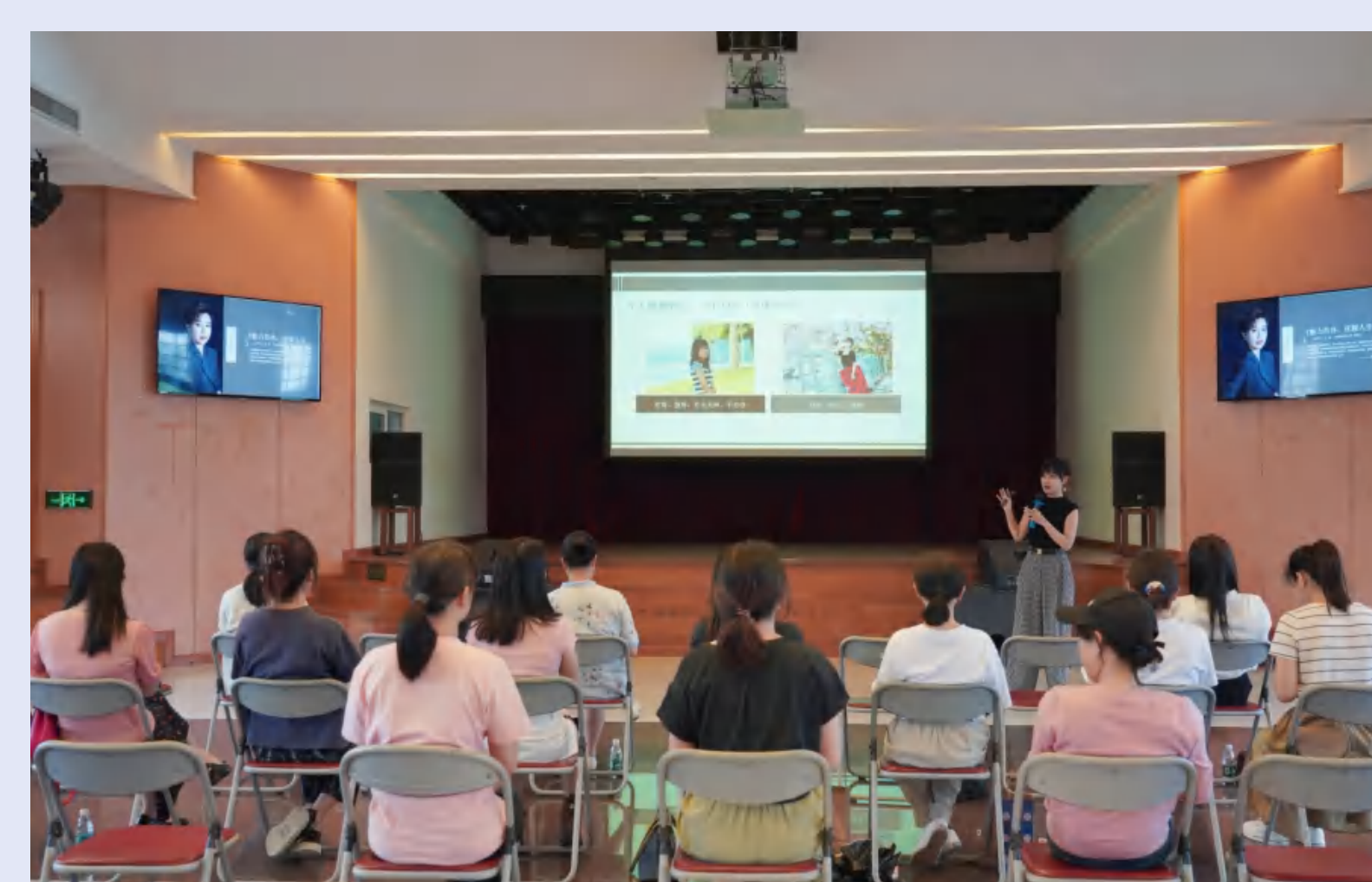
“魅力形体, 优雅人生”形体讲座