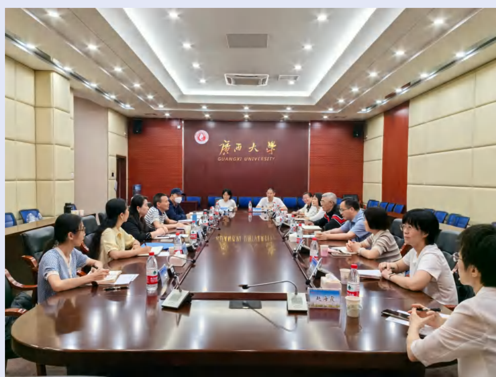
校工会教代会赴广西两所大学工会调研

积极加强对外交流学习,多次参加上级工会组织的交流培训;围绕多校园工会工作创新、教代会提案工作、工会财务、教工权益保障、工会信息化建设等内容赴广西师范大学工会和广西大学工会调研。接待华南农业大学、韶关学院、佛山科学技术学院等兄弟院校工会来访,探讨分享高校工会教代会工作经验,为高校同行创新联动发挥积极效应。