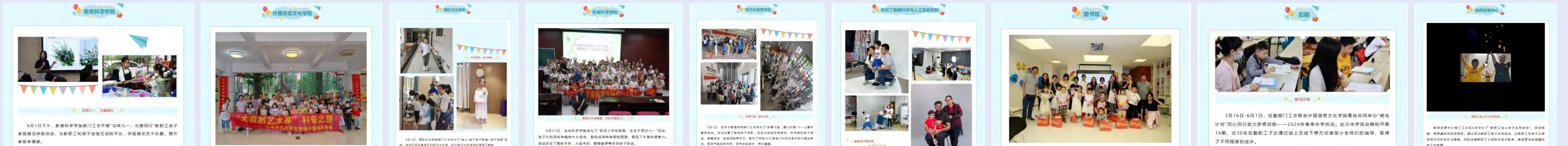
部门工会“六一”儿童节活动