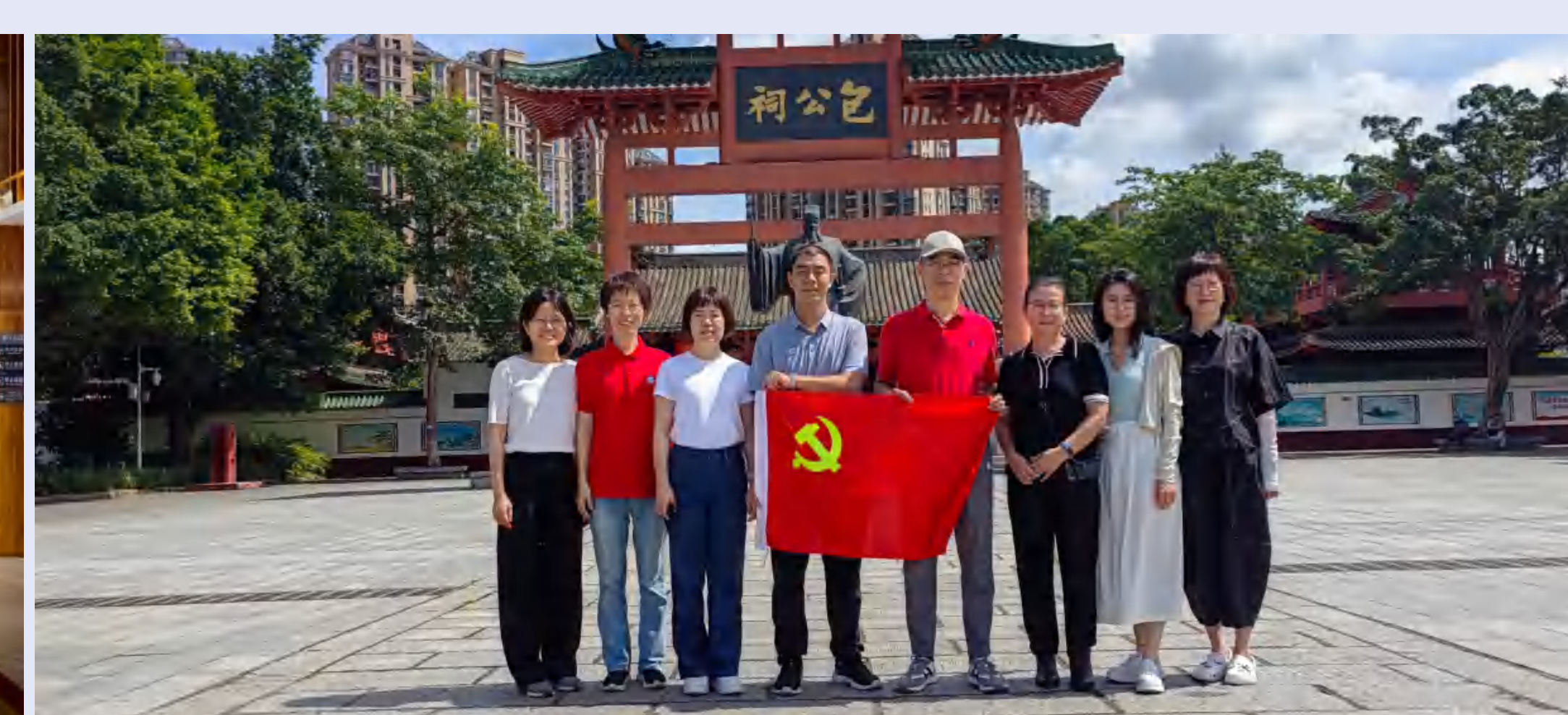
参观包公文化公园