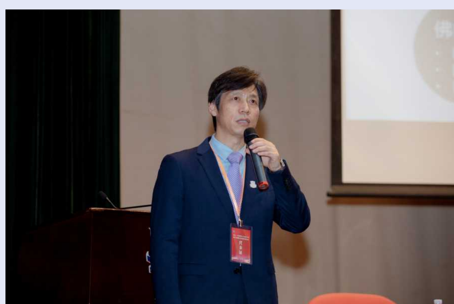
校党委副书记、校长杨中民作学校年度工作报告