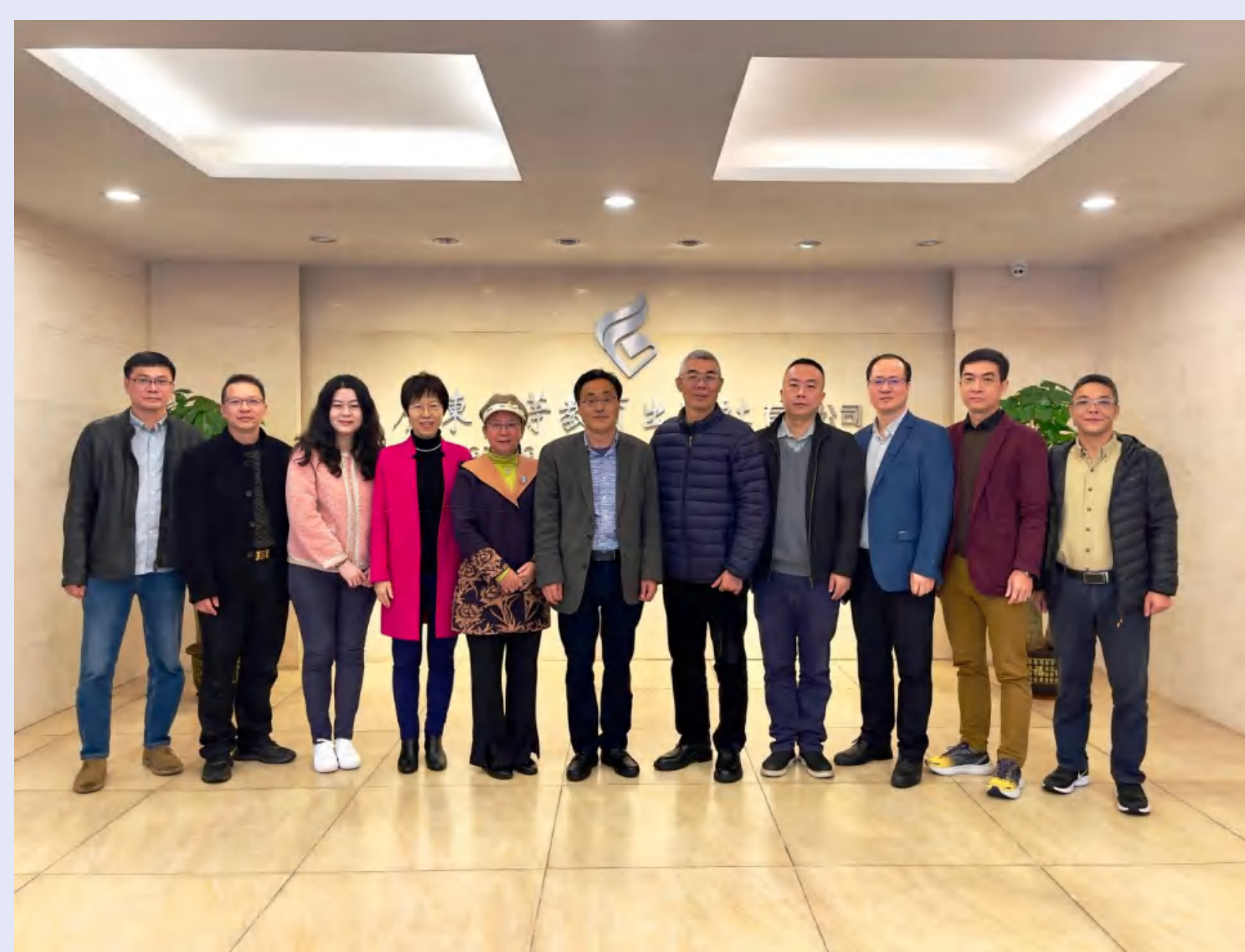
校工会一行到“两社”调研指导