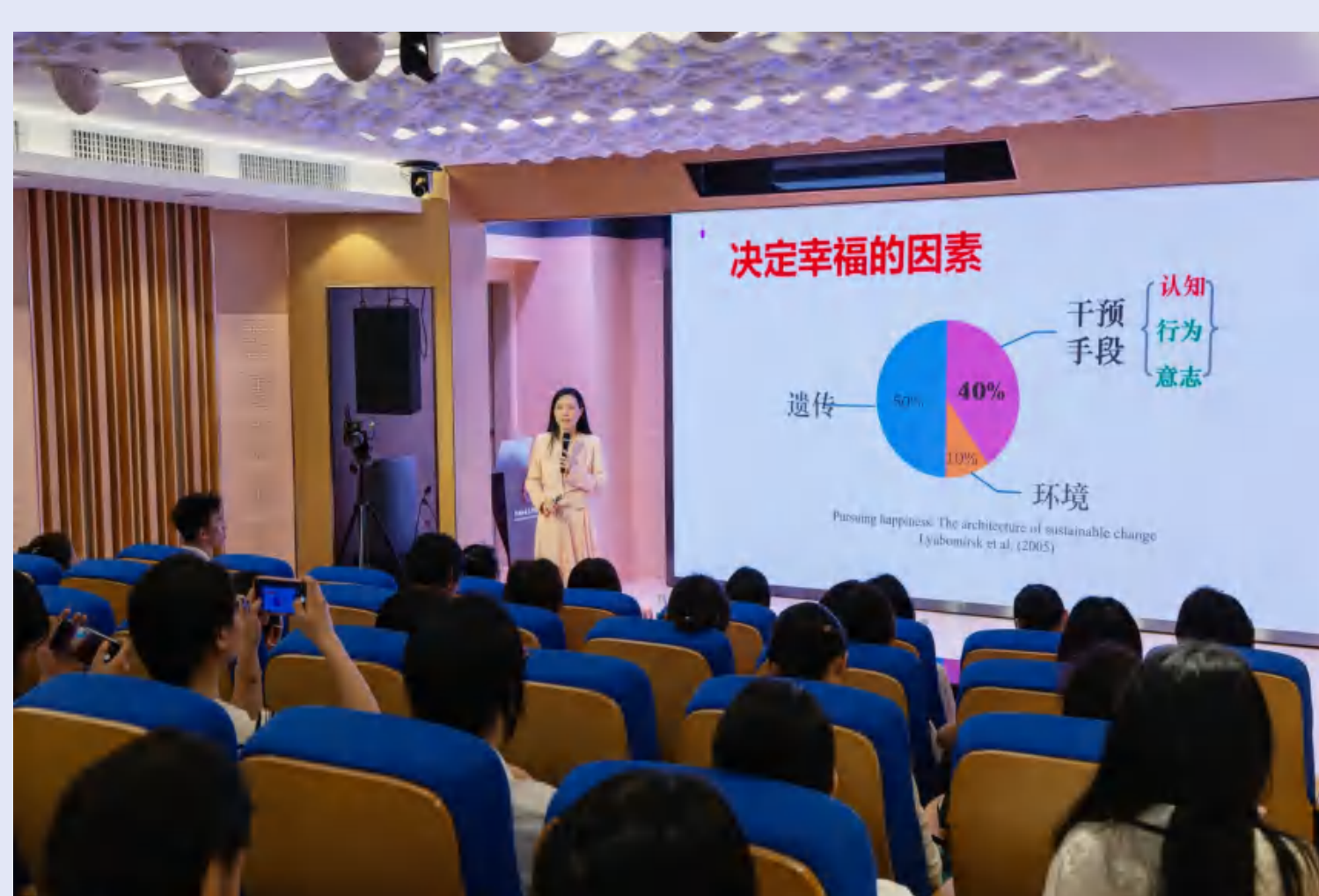
“寻找女性幸福的钥匙”心理健康讲座