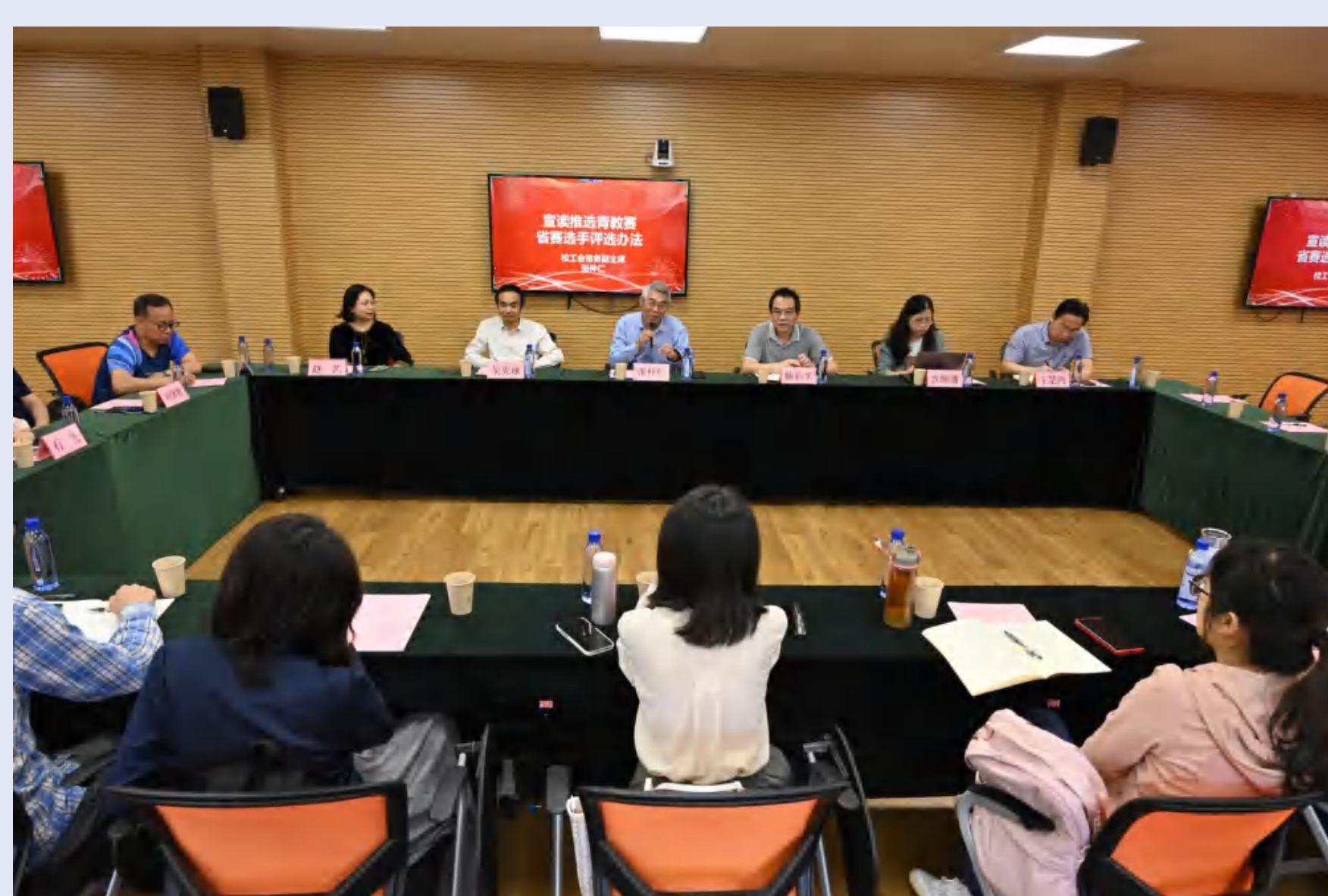
广东省第七届高校青年教师教学大赛赛前动员暨培训会现场

制定《华南师范大学教师教学竞赛实施办法(试行)》,进一步完善青教赛、创新赛的组织、保障和奖励等规定;做好广东省第七届高校青年教师教学大赛备赛服务保障工作。