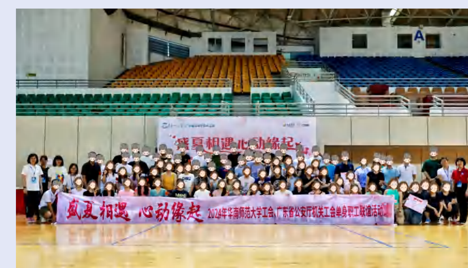
“盛夏相遇 心动缘起”单身联谊活动