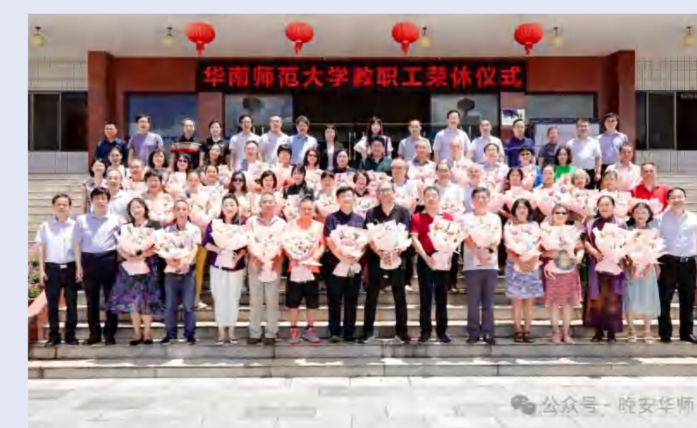
2023年7月至2024年6月 退休教职工荣休仪式合影