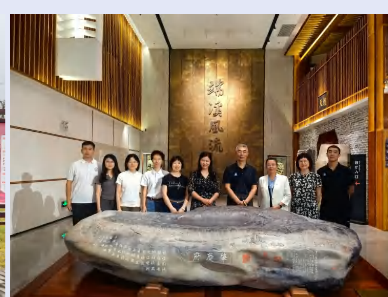
参观肇庆市端砚博物馆