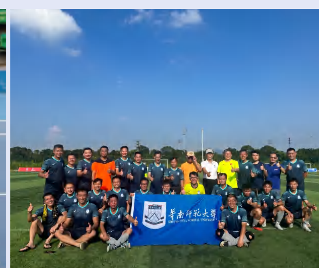
华师教职工足球队合影