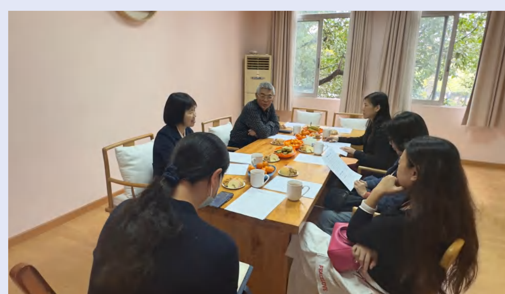
女职委委员工作交流座谈会