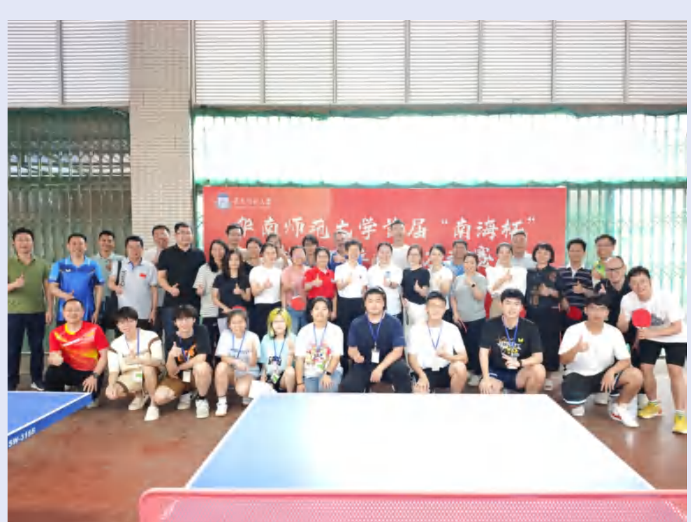
南海校园“南海杯”教职工乒乓球友谊赛

设立专项经费,做好“一校三区四校园”工会工作的提质增效。南海校园举办首届“南海杯”教职工乒乓球友谊赛。大学城校园开设第一期瑜伽班和形体班;举办“六一”亲子趣味运动会,共吸引了100个教职工家庭参加。汕尾校区开设教职工瑜伽学习班,组织校区春秋游及“六一”亲子软陶活动。