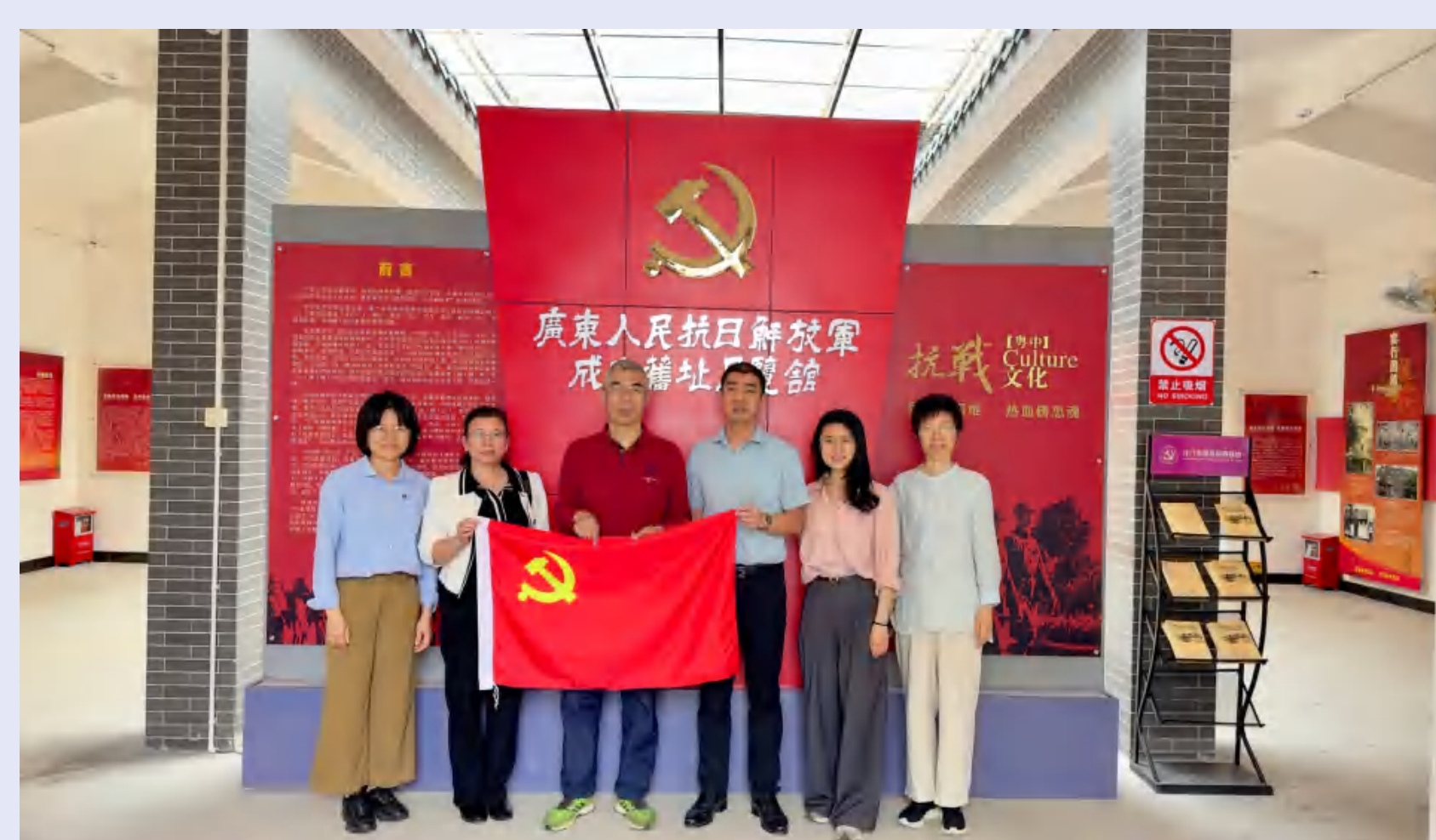
参观广东人民抗日解放军 成立旧址展览馆