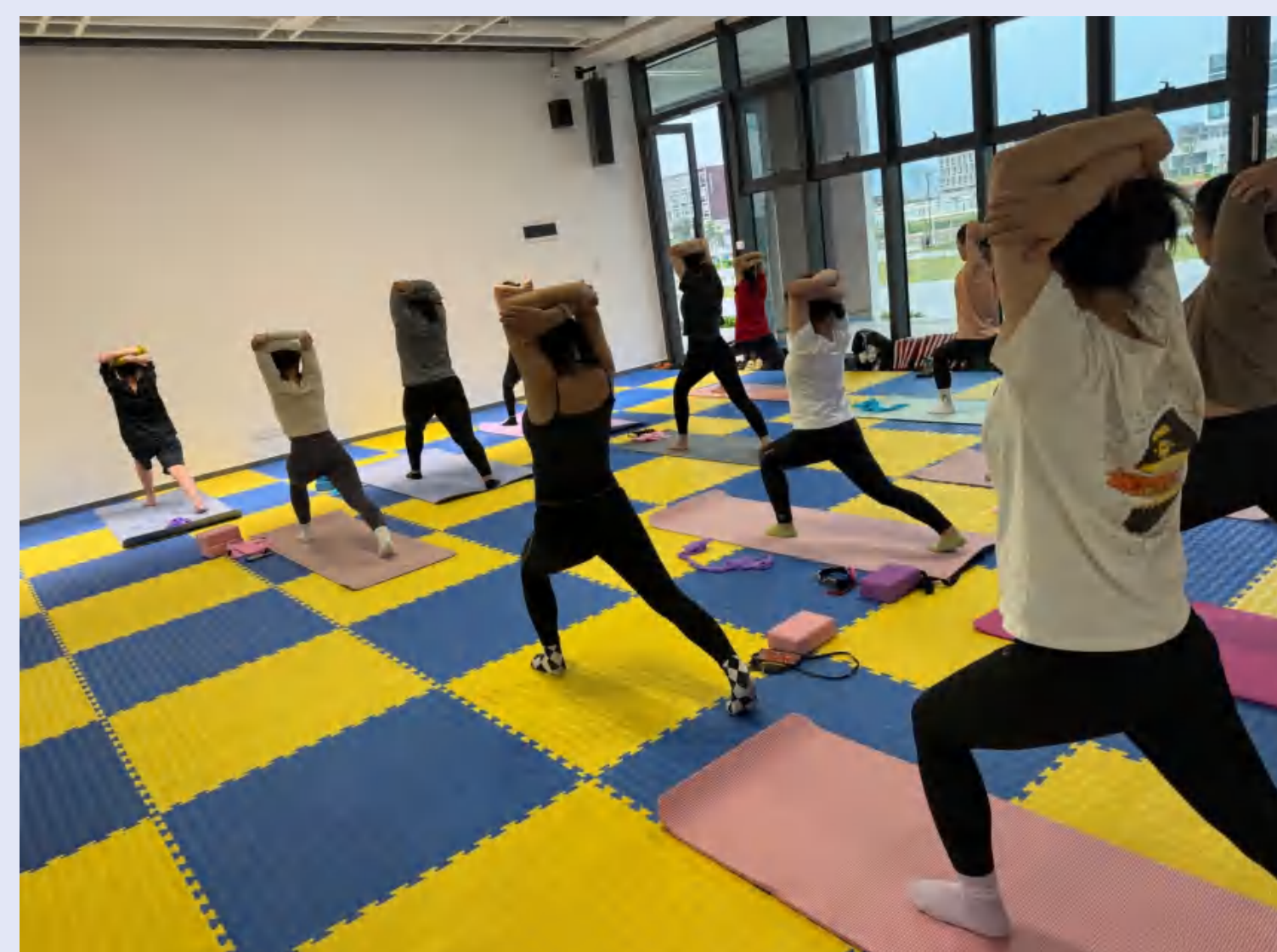
汕尾校区教职工瑜伽学习班