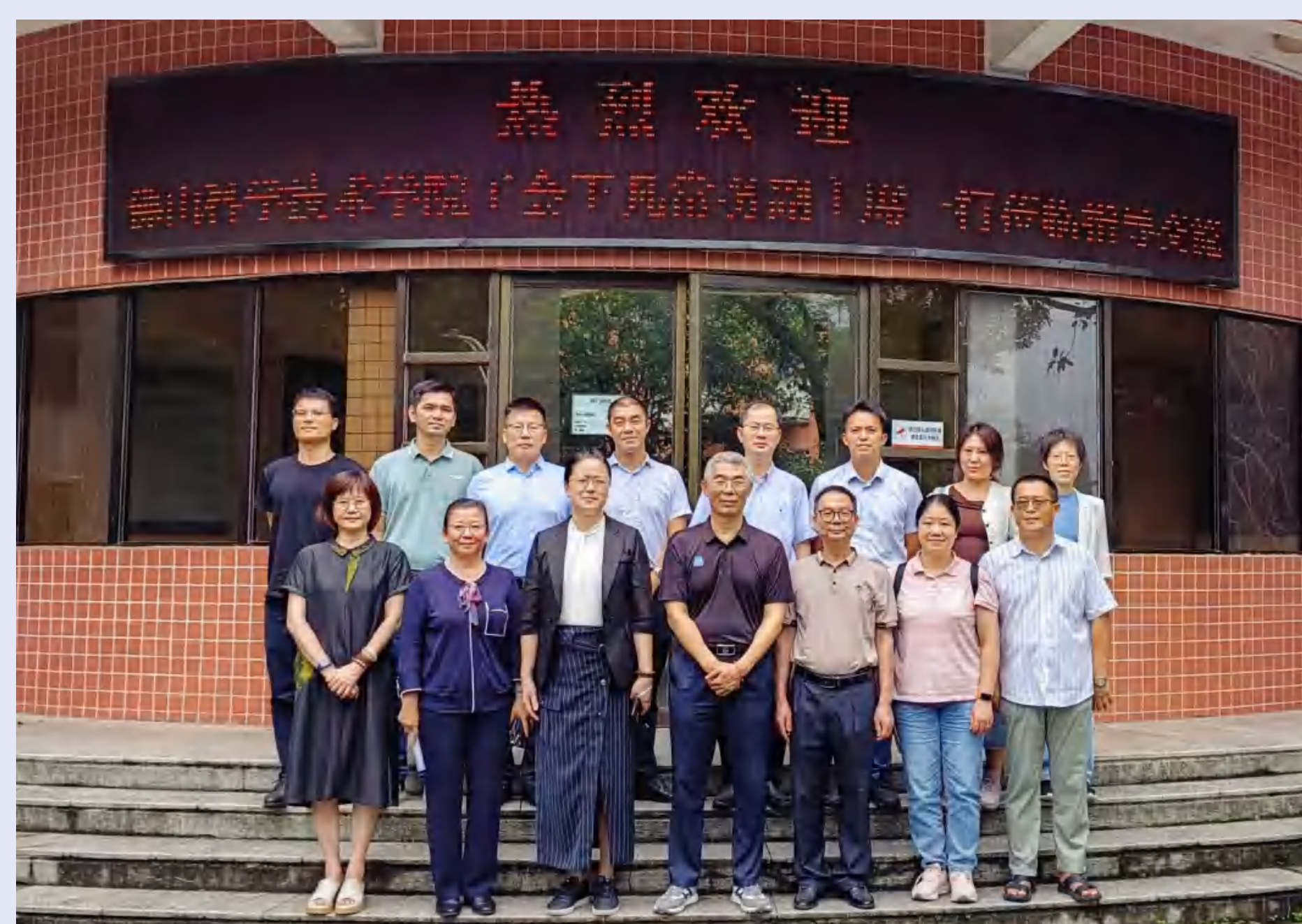
佛山科学技术学院工会到我校调研交流