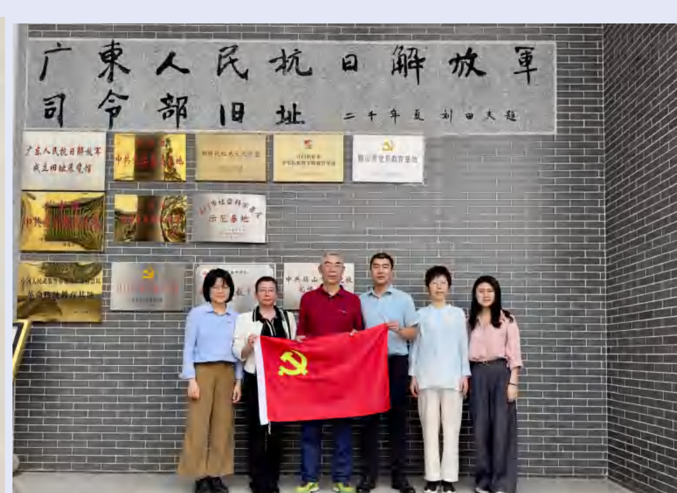
参观广东人民抗日 解放军司令部旧址