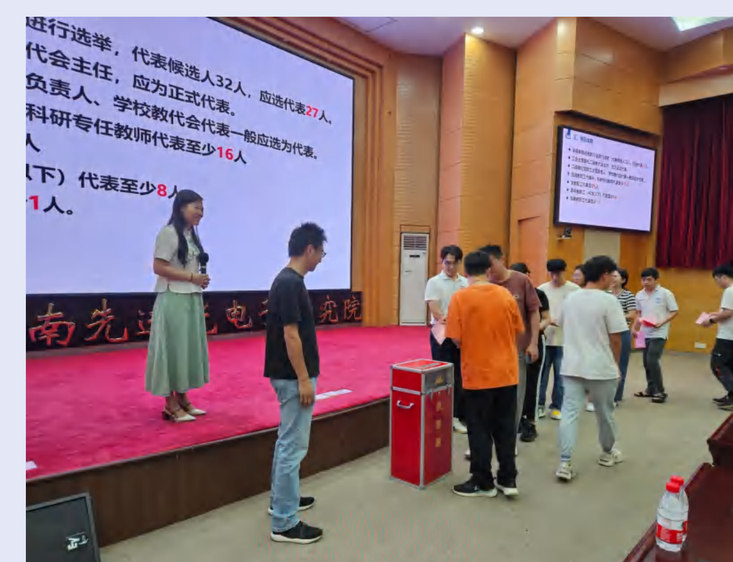
华南先进光电子研究院筹建二级教代会