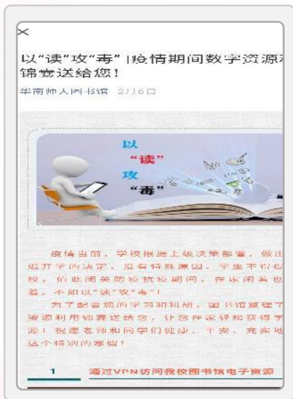
《以“读”攻“毒”，疫情时期数字资源利用锦囊送给您》