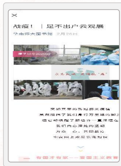
《战疫！足不出户云观展》