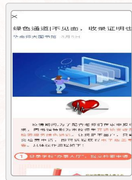
学科服务、查收查引等工作线上开展