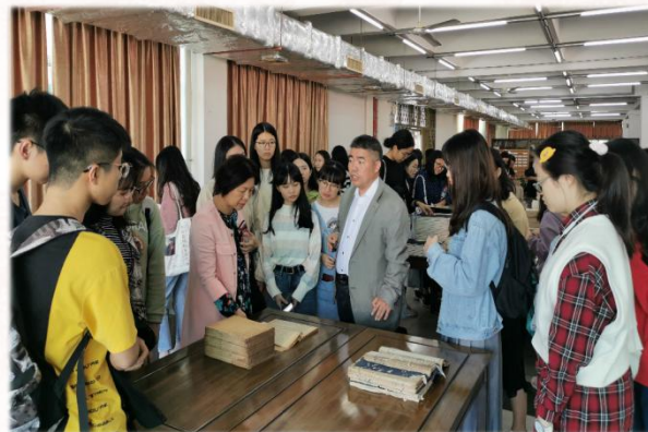
文学院双创周活动