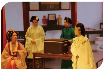
● “聚光经典”微话剧大赛

为获取文化推广活动最新资讯,请关注石牌、大学城、南海校园图书馆的文化推广活动公众号:“喜阅华师”、“砚湖书声”、“南苑书香”。