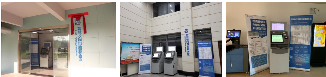
图：石牌校区、大学城校区、南海校区智慧校园自助服务区