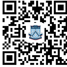
校园统一支付平台 二维码

微信或支付宝扫描“华南师范大学校园统一支付平台”二维码，打开“华南师范大学校园统一支付平台”，如下图所示。