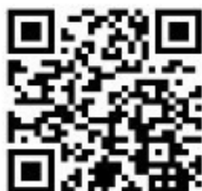
“心理学高研班”第 5 期报名登记二维码

https://www.wjx.cn/vm/PYmGcvv.aspx# ，并填写相关报名信息。入学资格审核通过后，将会有工作人员通过微信进行通知。