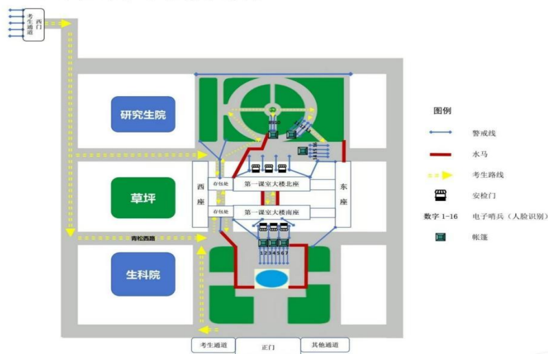
石牌校园考场通道示意图

石牌校园考区（ 第001-124考场 ）的考生可从正门（师大暨大公交站附近）或西门（华师地铁站E出口附近）进入。温馨提醒： 石牌校园的地址为广州市天河区中山大道西55号 。