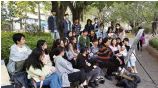
李启色院长写生课程示范

专业负责人：李启色，广东省汕尾人，1991 年毕业于广州美术学院毕业后至今在华南师范大学任教，现为华南师范大学创意设计学院院长、美术学院教授、硕士研究生导师。曾援藏任西藏大学艺术学院副院长。教育部学位与研究生教育中心评审专家，获“广东美术名师”。中国画创作研究院画家。中国美术家协会重彩画研究会理事，广东省中国画学会理事，广东书画研究会副会长，广州市天河区政协书画院副院长。二十多篇学术论文及一百多件美术作品在《美术》《美术观察》《装饰》《国画家》《艺术教育》《美术大观》《艺术世界》《书画世界》《华南师范大学学报》《暨南大学学报》等专业刊物发表，出版个人作品集八部，教材四部，专著三部，获批科研项目多项，多幅美术作品参加全国美展或省展并多次获奖。曾被中国文联评为“建国六十年·六十强画家”，曾被评为华南师范大学“我最喜爱的老师”。个人艺术事迹曾三次在央视书画频道报道，相关艺术事迹两次被《人民日报》报道，被评为“2022 年度全国优秀教师”称号。