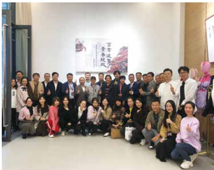
创意设计学院首届教师作品展

学院网址： http://cyd.scnu.edu.cn/ 联系电话： 0660-3808126