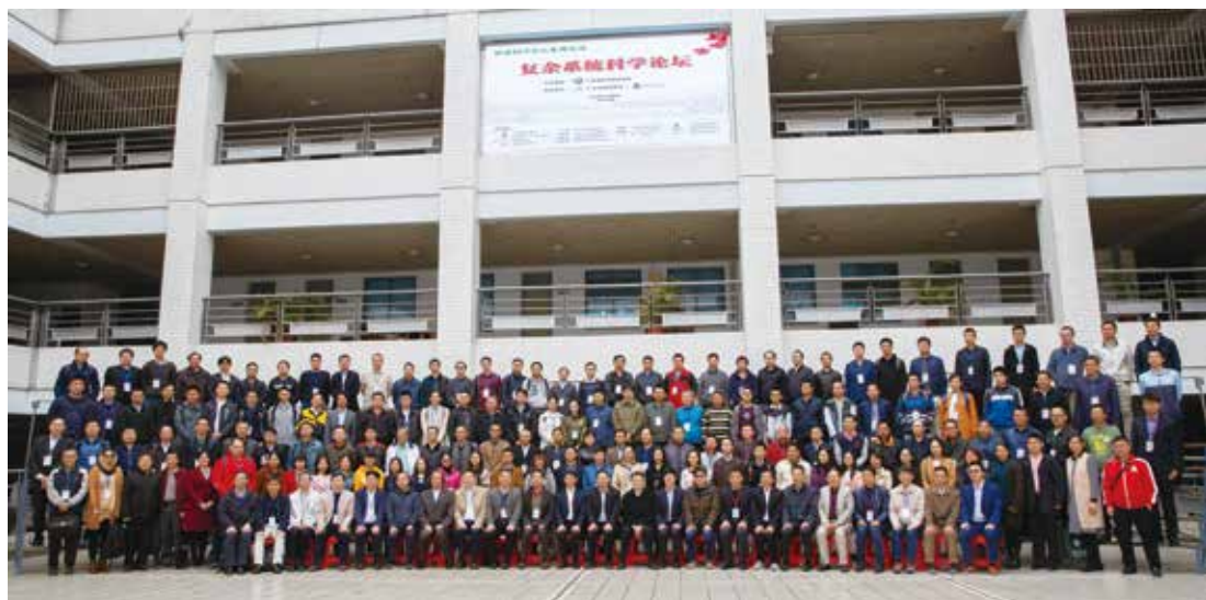
我院主办广东省物理年会

学院坚持“以生为本，注重实践能力和创新精神培养，突出过程与方法，促进知识、能力、素质全面协调发展”的办学理念，拥有国家级物理基础课程实验教学示范中心。学院适应社会需求，理工科并重，基础学科与应用学科协调发展。物理学专业入选国家级一流本科专业建设点，全国首批通过教育部二级师范类专业认证，获批“英才计划”实施学科等，全国首个教育部三级师范类物理学专业认证试点，是国家级特色专业、广东省名牌专业。