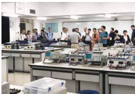
中南地区教指委到我院国家级物理学科实验教学示范中心参观指导