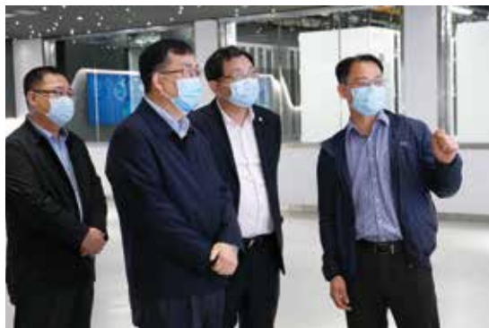
吴曦副省长视察南方核科学计算中心