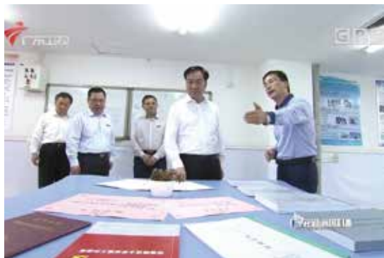
省委书记李希同志视察学生课外创新基地